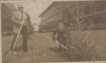
iskolák, óvodák, kollégiumok, diáklakások udvaraiban helyezték el. Az utolsót pedig a TIK parkjában ültette el április 22-

A nap folyamán több olyan fenyőfa is új helyre került, melyeket karácsonykor bérbe adott az SZTE Alma Mater. A fabérlés több éve nagyon népszerű a Tiszaparti városban: 2007-ben már több mint 120 fenyőt adtak ki az ünnepekre. Ezeket aztán a fűvészkertben, illetve szegedi