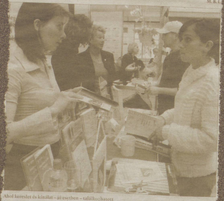
Ahol kereslet és kínálat – jó esetben – találkozik