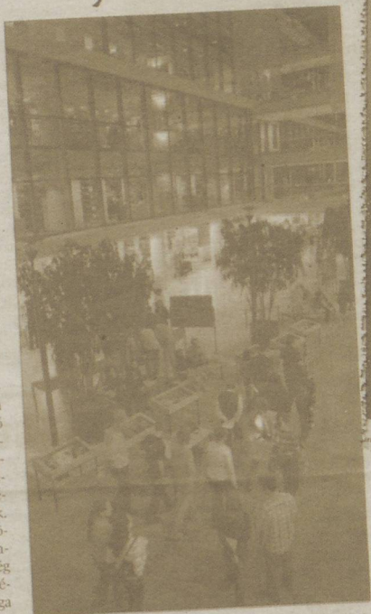
Éjszakai csendélet az egyetem tanulmányi és információs központjában.

Szegeden az egyetemi könyvtár próbaképp kitará kapuit – egyetlen éjszakára, szerdáról csütörtökre virradóan. Hajnali kettőig a TIK lényárban úszott, a könyvtárbarátok pedig a boldogságban. Ugyanis – talán a „műzeumok éjszakája” program-sorozat sikerén felbuzdulva – a szegedi egyetemi könyvtár olvasást, internetezést, filmvetítést kínált a szokatlan időpontban érkező látogatóknak. Igazi ajándéknak számított a kegyelem órája: éjfél-től hajnali kettőig a rég lejárt határidejű könyveket díjtalanul visszavették. Akadt, aki az akciónak köszönhetően három ezer forintot „bünt” spórolt meg. Még a TIK macskája, Penge is késett az alkalomra: sárga nyakörvet viselt ezen az estén.