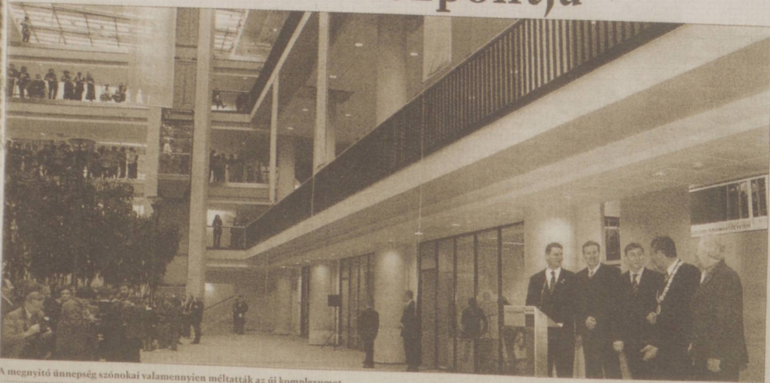
A megnyitó ünnepség szónokai valamennyien méltatták az új komplexumot

„Istenemre, de szép dolgot csináltak, nagyon szépet!” Ezekkel a szavakkal fejezte ki elismerését és meglepett elragadtatását Gyurcsány Ferenc miniszterelnök a Szegedi Tudományegyetem ünnepségén, az Ady téri tanulmányi és információs központ impozáns átriumában. Tegnap megnyílt és megkezdte működését az új egyetemi könyvtár és kongresszusi központ.