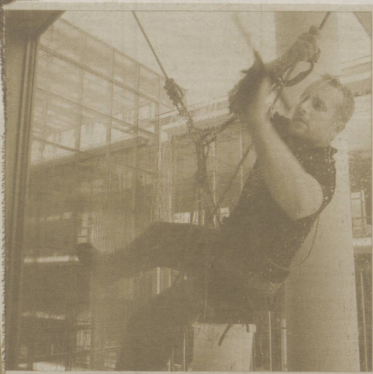
„Lógok a szeren.” Ipari alpinista tisztítja a TIK ablakait