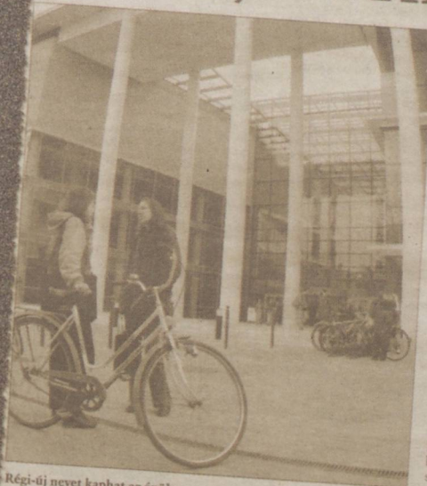
Régi-új nevet kaphat az épület