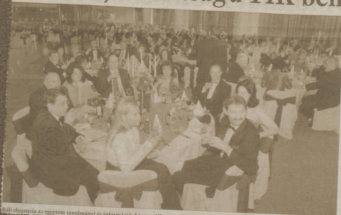
Báli elegancia az egyetem tanulmányi és információs központjában