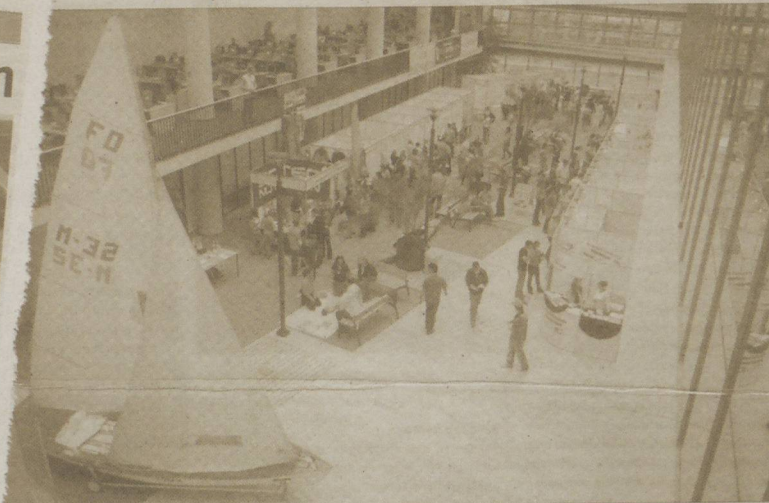
A Szegedi Vitorlás Egylet hajója a III. Egyetemi Egészségnapon a TIK átriumában.

Minden, az egészséges életmóddal, a rendszeres testmozgással és egészségmegőrzéssel kapcsolatos információt megkaphattak azok a hallgatók és középiskolások, akik ellátogattak a Szegedi Tudományegyetem egészségnapjára október 24-én a József Attila Tanulmányi és Információs Központba.