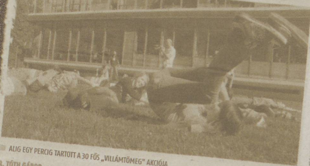
ALIG EGY PERCIG TARTOTT A 30 FŐS „VILLÁMTÖMEG” AKCIÓJA