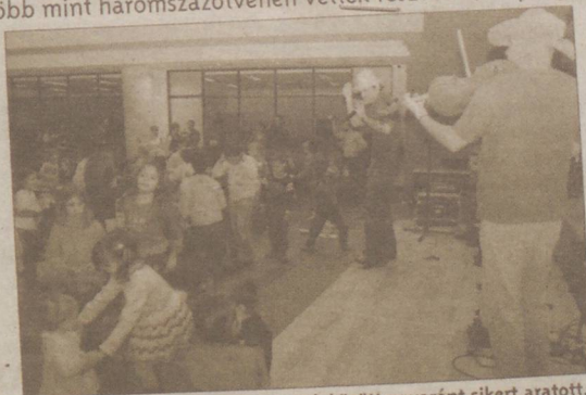
Az Alma Együttes kicsik és nagyok között egyaránt sikert aratott.

Az ünnepség az Alma Együttes interaktív Mikulás-váró koncertjével kezdődött. A fővárosi zenészek a gyerekközönség segítségével aktív nyomozásba kezdtek a Mikulás bácsi elveszett aranyalmája után. A jókedvű koncert klasszikus és kortárs költők megzenésített verseire épült, érdekes és meglepő fordulatokkal, az előadás végére arra is fény derült, hova tűnt az aranyalma (ideiglenesen egy szarka fészkében landolt), s végül a Mikulás is megérkezett segédeivel.