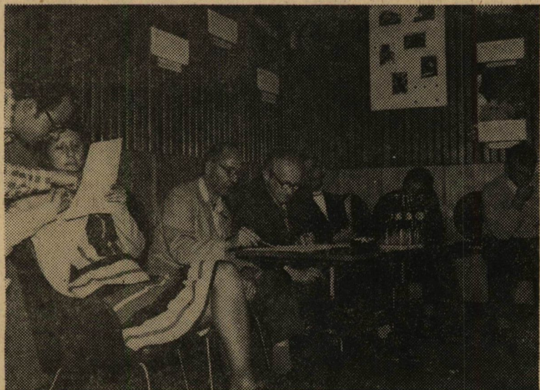
A győztes III. éves csapat (balról) és a IV. évesek