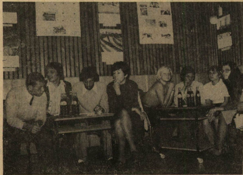
Gondban a zsűri

A verseny nagyon szoros volt. A harmadévesek végig biztosan vezettek, az első- és másodév között azonban heves küzdelem alakult ki. Végül is az elsősök lettek a másodikak, a másodévesek nem sokkal, mindössze három ponttal maradtak le mögöttük. A negyedik helyen a negyedévesek végeztek. A versenyzők jutalma egy-egy szép könyv volt. Végül is azt lehet mondani, hogy mindenki győztesként került ki a vetélkedőből, hisz egy nagyon kellemes és hasznos estét töltöttünk együtt.