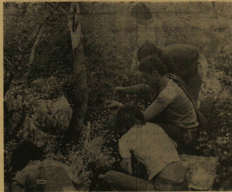
Munkában... (Fotó: Turi Tibor)

mind megtaláltattak. Szerdától vasárnapig sajnos, rövid az idő, főleg ha az ember jól is érzi magát. Alig vettük észre és már csomagolnunk kellett. Volt olyan, aki még az utolsó percekben futva még egyszer megtette a kem-