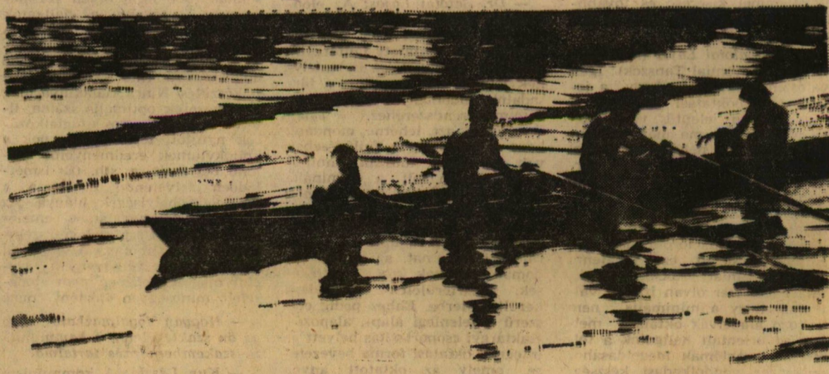
Nyári estén a Tiszán

A Szegedi Orvostudományi Egyetem Tanácsa szeptember 8-án a Szabadság Filmszínházban nyilvános, ünnepélyes doktorrá avató ülést tart.