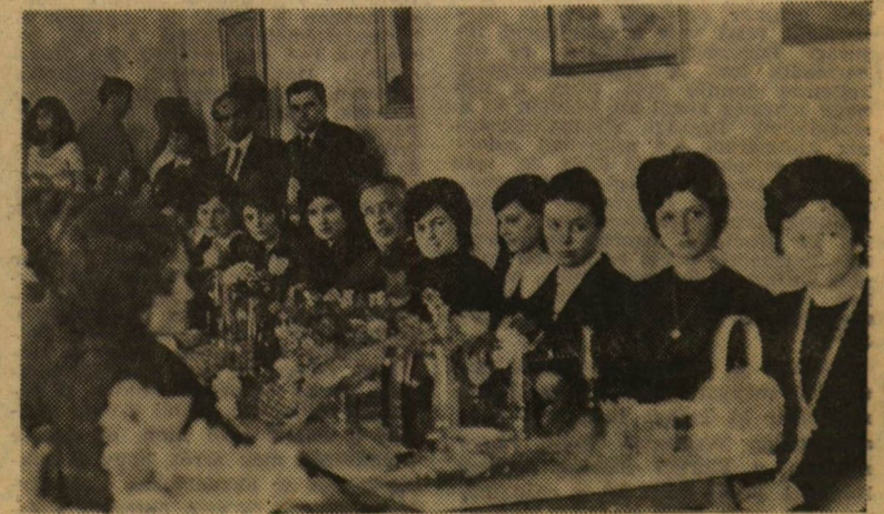
Főiskolások a Műszaki Tanszéken.