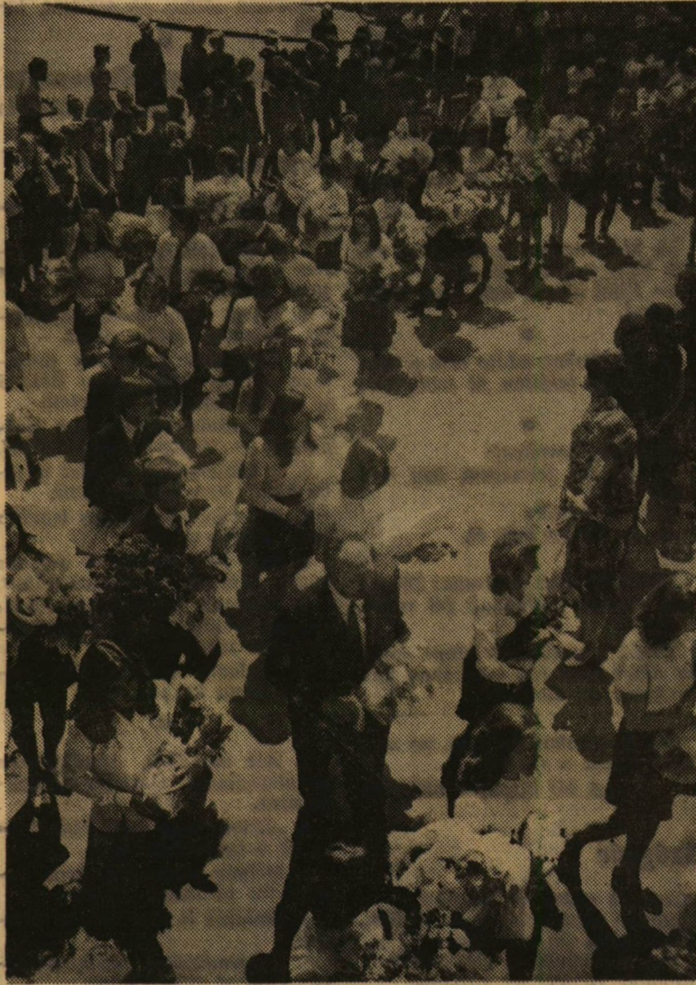
Ségváris gimnazisták az Aradi vértanúk terén.