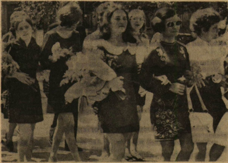
Főiskolások a Kárász utcán