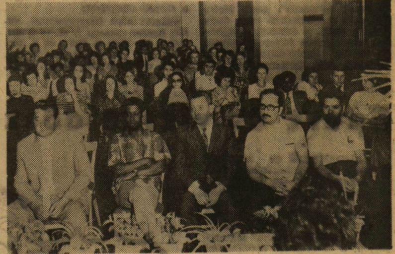
Gyógyszerészek a klinikán.