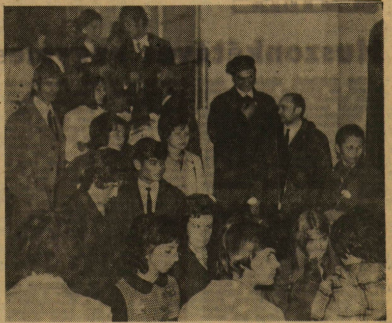
A TTK-végzős hallgatói a Bólyai épület előcsarnokában.

A ballagásoknak vége. A könnyes búcsúszavak és a fogadkozások után az utolsóéves hallgatók egyik legnagyobb erőpróbjára következnek: az államvizgákra való felkészülés. Ehhez és az egyetem, főiskola befejezése utáni munkához minden búcsúzó diáknak mi is sok sikert kívánunk.