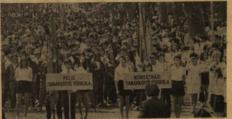
A találkozón résztvevő pedagógusjelöltek kétezres tömegének egy csoportja a Széchenyi téren.