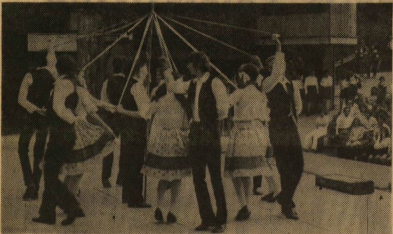
Pillanatkép a Pécsi Tanárképző Főiskola tánckarának bemutatójáról.

7-én este a Szegedi Nemzeti Színházban, a gálaesten a „házigazdák” szórakoztatták a találkozó résztvevőit. A mintegy másfél órás rendkívül színvonalas műsorban felléptek a főiskola irodalmi színpadának tagjai, az I. sz. Gyakorló Iskola Mozart és Bartók gyermekkórusa, a főiskola női kara, zenekara, valamint a Liszt Ferenc Zeneművészeti Főiskola zenekara. A sikeres mű-