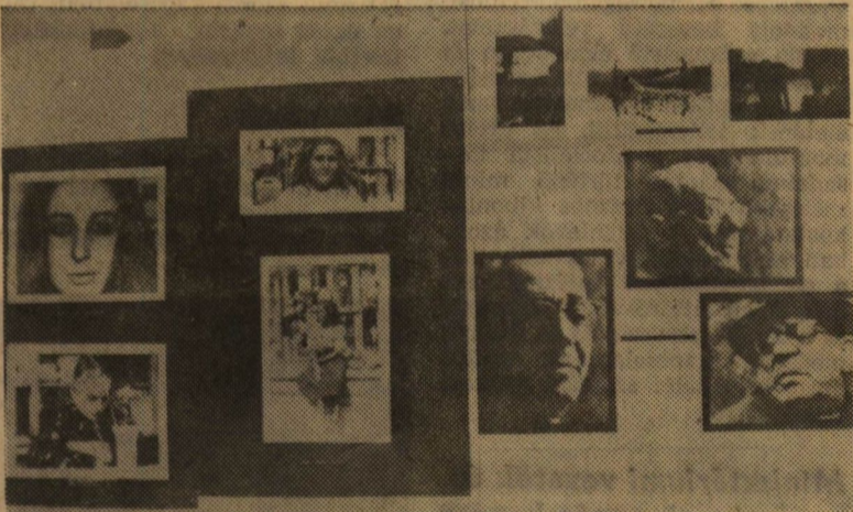
Tabló a fotókiállításról.