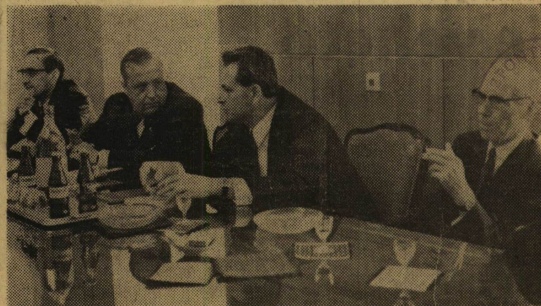
Turku város polgármestere a két rektor társaságában