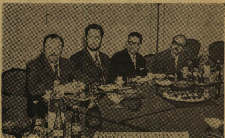
A finn vendégek másik csoportja