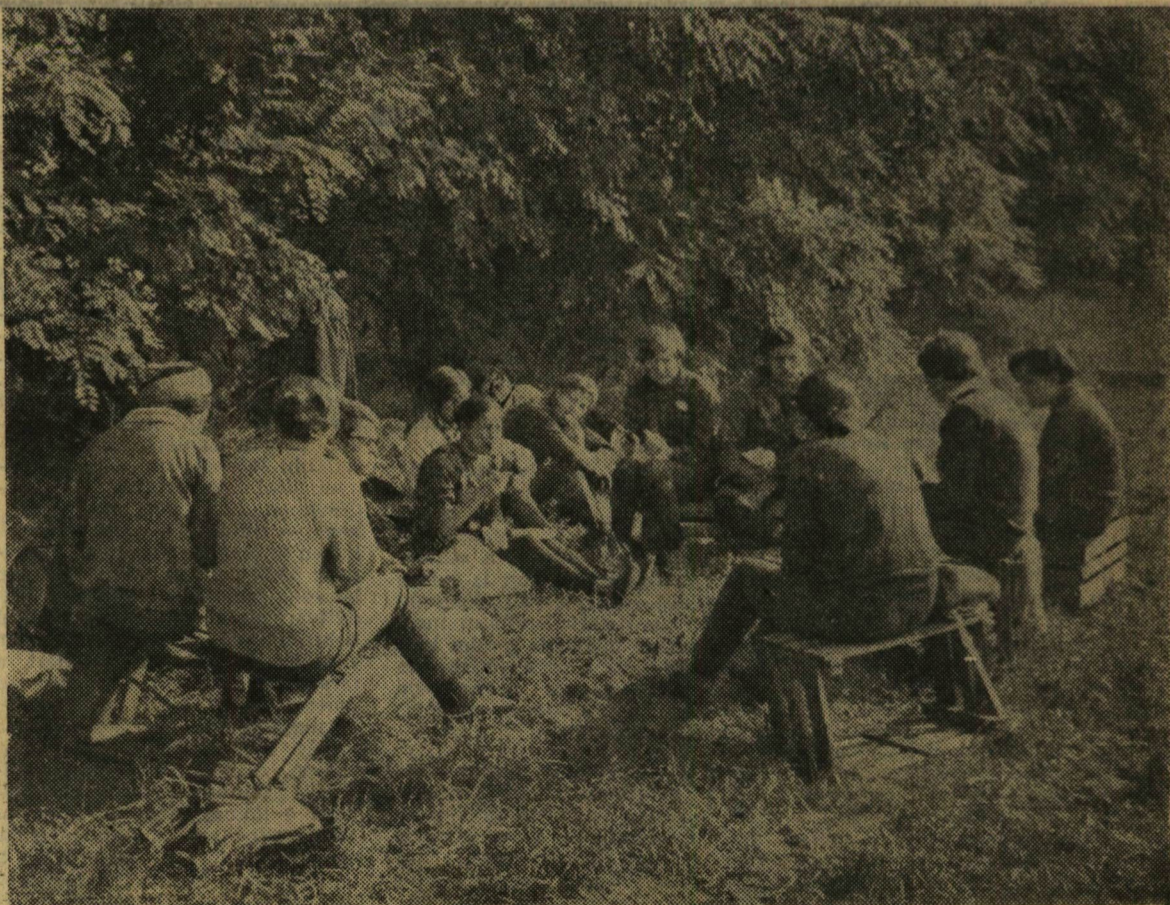
Együtt.