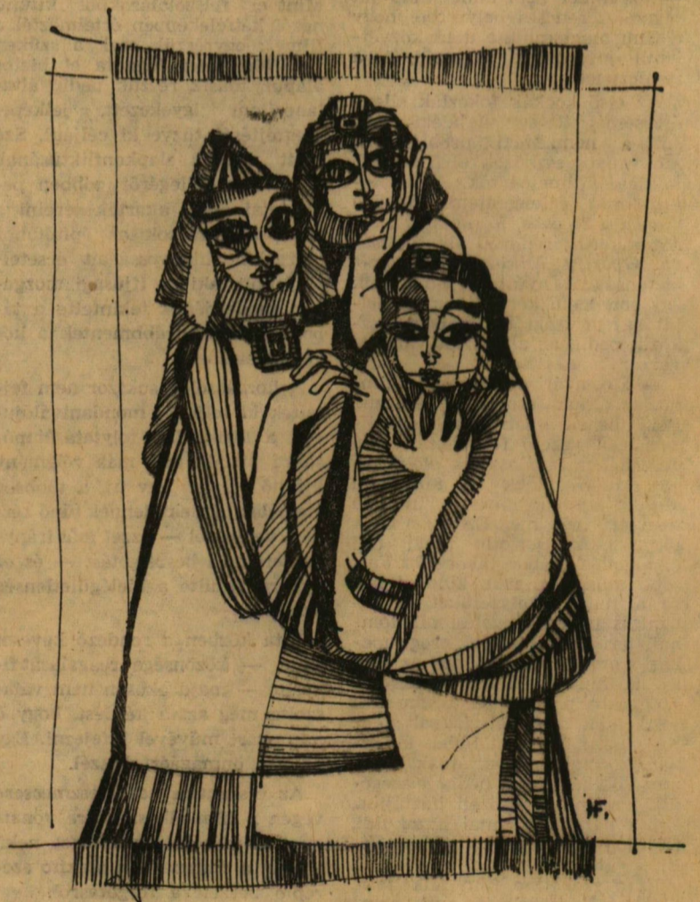
Holpert Flóra rajza

Sok más külföldi esemény mellett jelentős még, hogy a Művelődésügyi Minisztérium és a Kulturális Kapcsolatok Intézete tíz fiatal Petőfi-kutatónak hat-hat hónapos ösztöndíjat juttat magyarországi tanulmányútra.