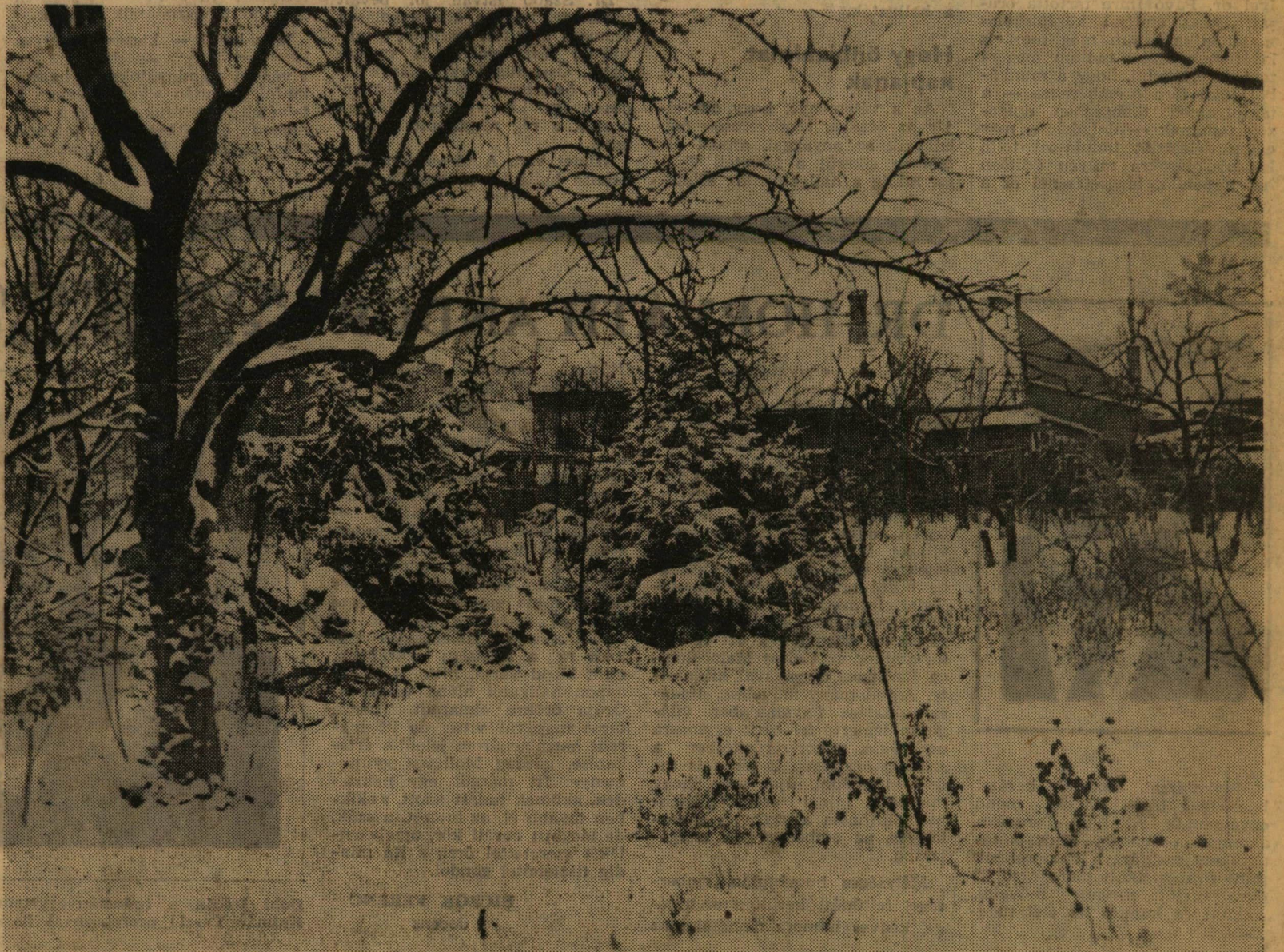
Fotósunk még emlékszik a téle

A korábban a karon már bemutatkozott Régészeti és Orosz Nyelvtörténeti Diákkörök után most a néprajzosok és a pszichológusok is újabb híveket szereztek választott tudományáguknak, bizonyítva, hogy a tudományos diákköri munkának szélesebb nyilvánosságot biztosító kari kezdeményezés hasznos, követésre érdemes.