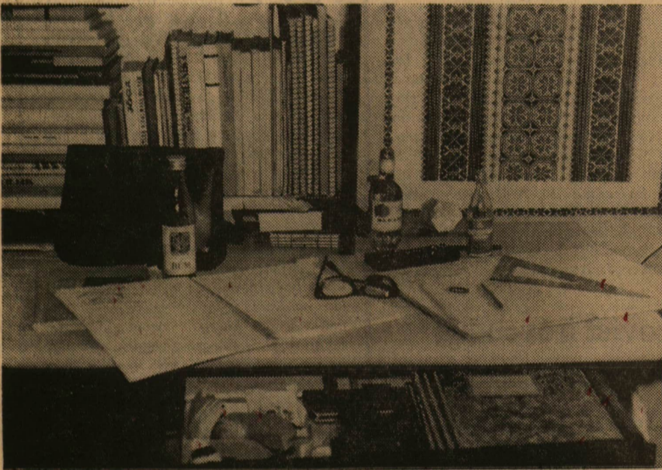
Kell — ékeink