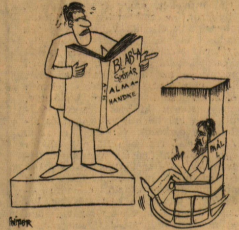
Paál: — Még nem elég egyhangú!

hogy — elsősorban saját egészségük védelme érdekében — keressék és megteremtsek a lehetőségeket „de más lenne itt az élet!” Rá kell érni!