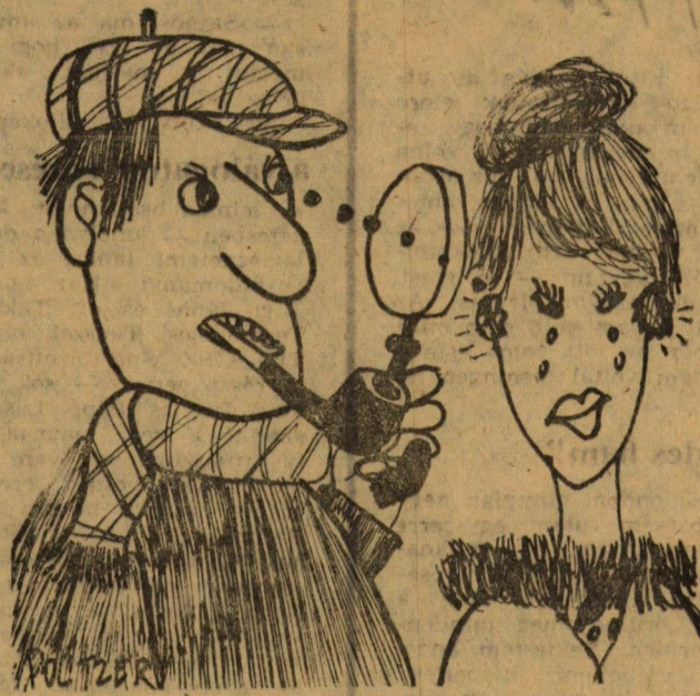
- Sajnálom, hamis ékszerrel nem engedhetem be!