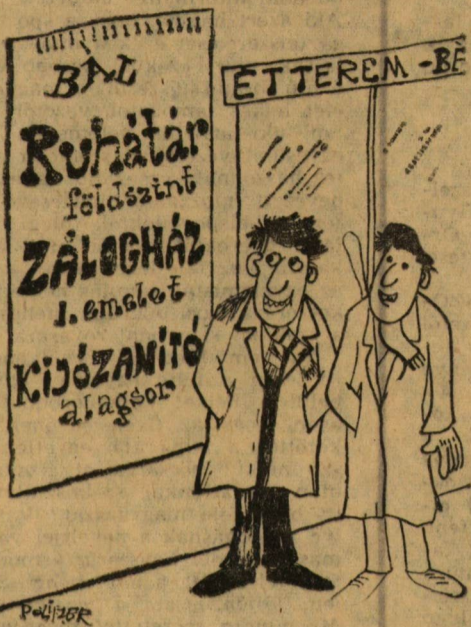
- No, ide bemegyünk!