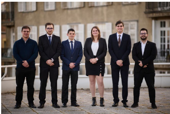
Alkotmánybírósági Szimulációs Verseny – csapatkép

Alapvetően a feladatokhoz, munkához való hozzáállás a személyiségünk függvénye, amennyire én ezt tudom. Nekem mindenesetre gyerekkoromtól