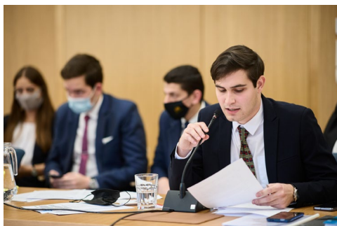
Alkotmánybírósági Szimulációs Verseny - Gellért

Nem lehet elégszer hangsúlyozni, hogy az egyetemi évek nem szabad, hogy csupán a kötelező tárgyak teljesítéséről szóljanak. Ezen alapvető kötelezettségeken kívül számos lehetőség kínálkozik a hallgatók számára, amiket erősen ajánlott kihasználni, mindenkinek személyre szabva természetesen. Ebbe a körbe tartozik a tehetséggondozás is, amire karunk kimagasló figyelmet fordít.