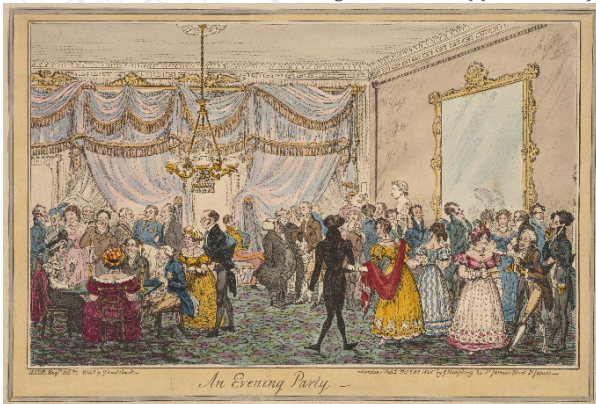
Illusztráció: George Cruikshank ((1792–1878)