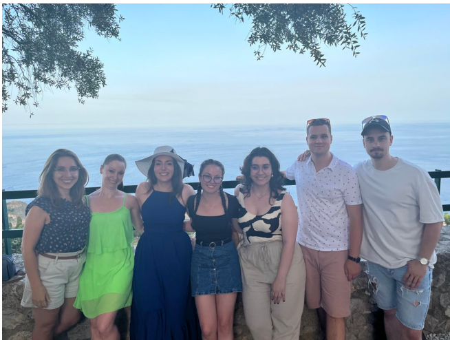
A szegedi csapat egy része /messinai BIP/

Ugyanakkor szeptember második felében a Karunk is otthont adott egy hasonló témával foglalkozó BIP-nek a BTI szervezésével.