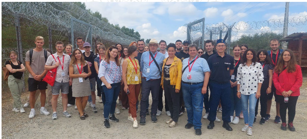
Külföldi és magyar joghallgatók, illetve oktatók a műszaki határzánál /szegedi BIP/

Nagyon jó mindkét szerepben részt venni. Résztvevőként nyilván kevésbé megterhelő, és persze szervezőként nyilván kevesebb új dologgal találkozunk, de mégis hálás feladatnak tartom ez