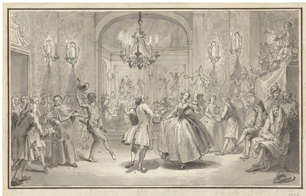
Illusztráció: Simon Fokke (1712–1784)

Alapvetés: Pontosan érkezzünk! Nincs annál kínosabb, mint mikor valaki úgy esik be az ajtón. Ráadásul éjfélig fennáll egy előre meghatározott menetrend is, magába foglalva többek között a nyitótáncot, beszédeket, egyéb programokat. Mindenkinek jobb, ha időben odaérünk és nem maradunk le semmiről, nem zavarjuk meg egyik napirendi pontot sem.