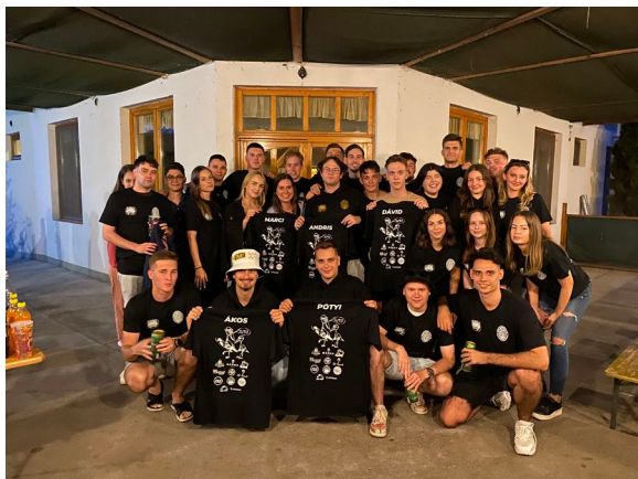
A szervezői csapat

más-más képességre, ügyességre volt szükség, amelyeket a csapatmunkával teljesítettek a fiatalok, mindenki hozzájárult a sikerhez. Voltak vicces, kreativitást igénylő feladatok, mozgásos, erőnléti feladatok és nem mellesleg ivós