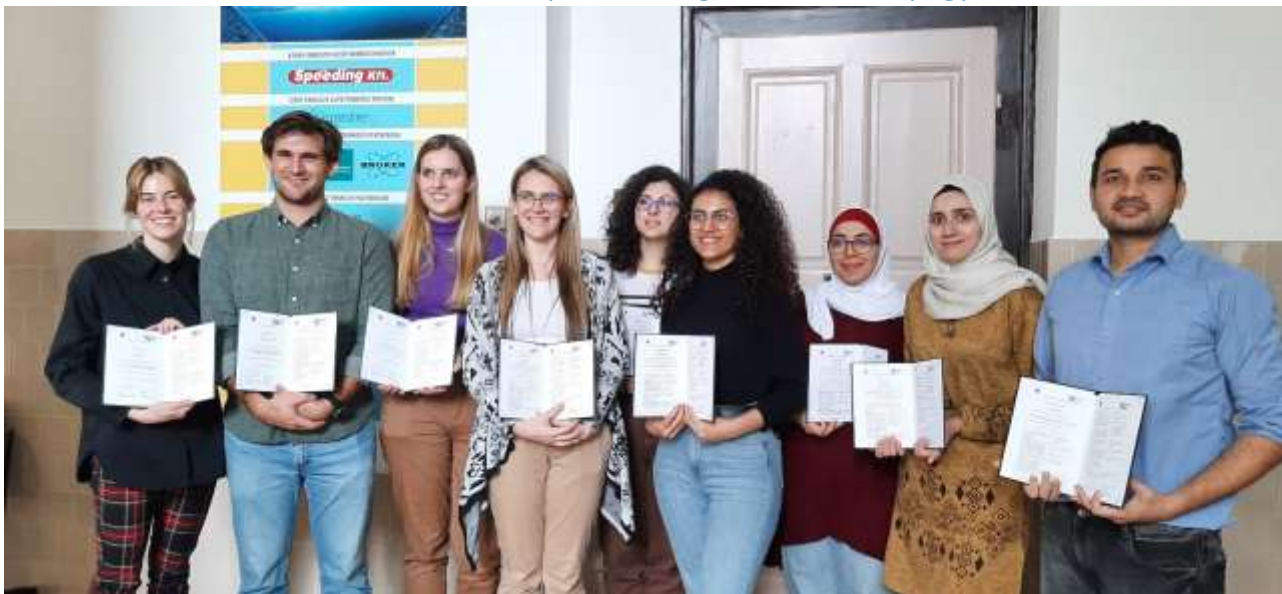
(A fotón az „A” és „B” szintű képzés résztvevői láthatók)

A Szegedi Tudományegyetemen hatodik alkalommal került megrendezésre a friss nemzetközi akkreditációval rendelkező angol nyelvű, az idei évtől „A” és „B” szintű (40 és 80 órás) FELASA (Federation of European Laboratory Animal Science Associations) tanfolyam „Animal experiments theory and practice A and B levels” címmel. A képzést a Sebészeti Műtéttani Intézet szervezte meg 2023. január 23. és február 3. között. Az elméleti képzés jelentős részét online, míg a gyakorlati képzést személyes részvétellel bonyolították le a szervezők. Az oktatók között a Sebészeti Műtéttani Intézet, az Orvosi Fizikai és Orvosi Informatikai Intézet, a Neurológia Klinika, a TTIK Élettani, Szervezettani és Idegtudományi Tanszék és az ELI Sugárbiológiai Kutatócsoport munkatársai szerepeltek. A résztvevők Ausztriából, a Dél-Afrikai Köztársaságból, Indiából és Jordániából érkeztek, mellettük az SZTE intézeteiből szíriai, jordániai és magyar PhD hallgatók vettek részt a tanfolyamon. A képzést záró elméleti és gyakorlati vizsgák után az „A” szintű képzésen 6-an, a „B” szintű képzésen 3-an szereztek a világ összes országában elismert jogot laboratóriumi állatok felhasználásra épülő kísérletek végzésére és projektek tervezésére.