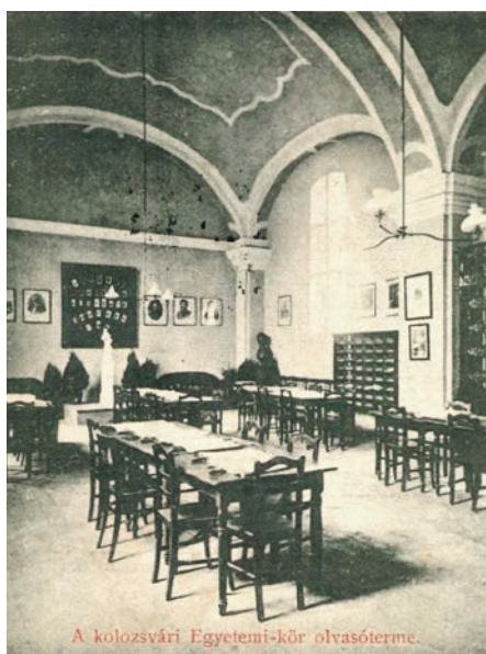
A kolozsvári Egyetemi-kör olvasóterme.