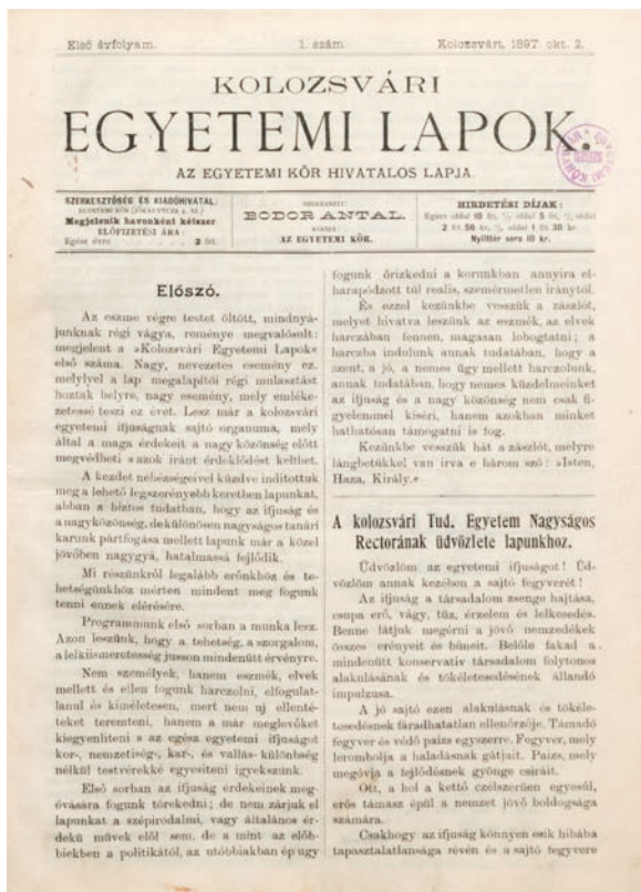
65. kép A Kolozsvári Egyetemi Lapok első számának címlapja

diáklapnak: az orgánium szerkesztő és cikkíró stábjá is a kör tagjai – nemegyszer, amint ezt látni fogjuk, a kör vezető tisztségviselők – közül került ki.