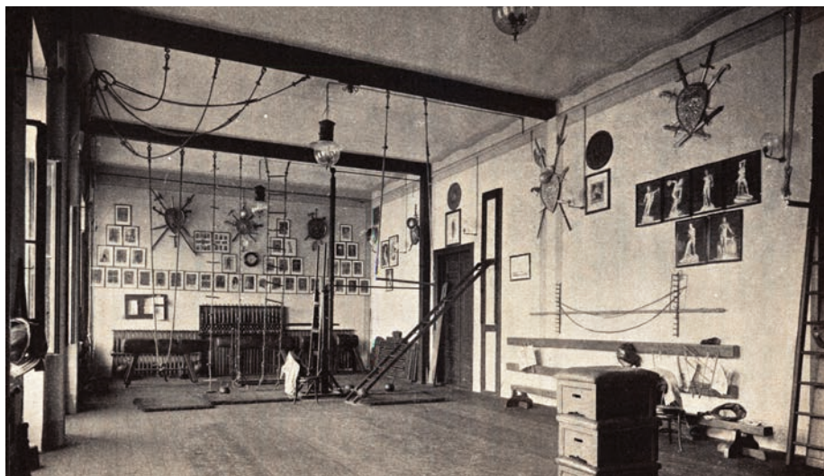
67. kép A központi épület torna- és vívóterme

A magyar egyetemi sportegyesületek közül harmadikként – 1902-ben – létrejövő Kolozsvári Egyetemi Atlétikai Clubbal (KEAC) pedig megszületett az önálló kolozsvári egyetemi diák sportegyesület. 265 Kolozsvár és így a kolozsvári egyetemi sportélet történetét – az ezt meghatározó egyéniségek szerepét 266 is bemutatva – Killyéni András több könyvben, tanulmányban és ismeretterjesztő írásban feldolgozta.