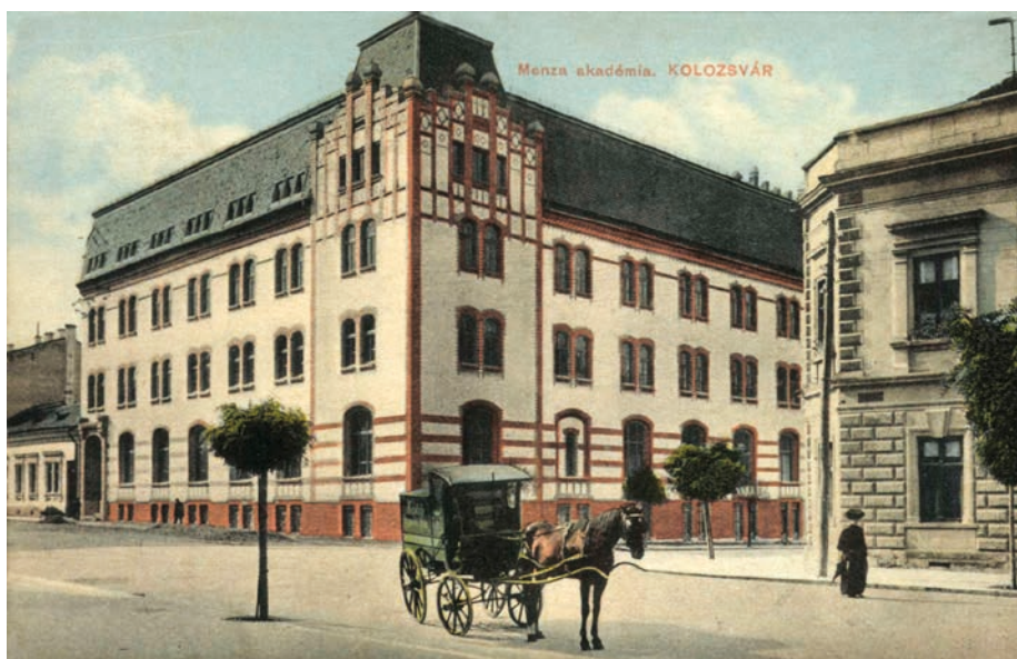
68. kép Mensa Academica, 1918

Ezek a tanévenként megjelenő almanachok közlik a hallgatók szociális támogatását szolgáló alapítványok főbb adatait is. A legutolsó – az 1917/18. tanévre – kiadott almanach összesen 35 ilyen alapítvány főbb adatait (a kar neve, amely az alapítványt kezeli, az alapító neve, az alapítvány célja, az alaptőkéje) sorolja fel. 272