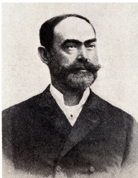
37. kép Davida Leó (1852–1929), a bonctan professzora (1882–1919)