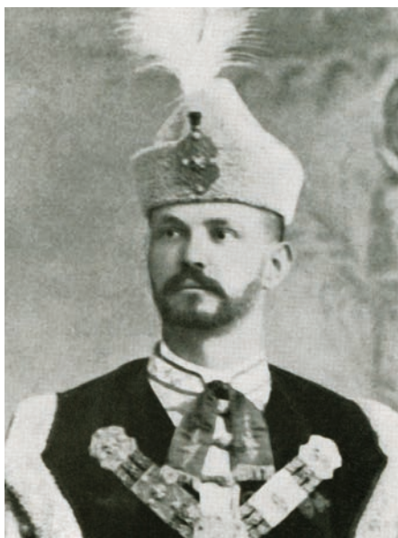
41. kép Lőte József (1856–1938), a kórtan professzora (1890–1927)

3. A kolozsvári Orvos-Sebészi Tanintézet belgyógyászatára 1869. június 17-i dátummal nevezték ki. 147 Az 1872-es egyetemalapítás során így kapta kinevezését az egyetem belgyógyászati tanszékére. A Budapestre távozó Schulek Vilmostól átvette a rektori méltóságot az 1873/74. tanév utolsó (1874. április 25-től kezdődő) időszakára. 1874 tavasza óta tüdőbetegségben szenvedett, betegszabadságot kapott az 1874/75. és az 1878/79. tanévekre. A belgyógyászati szigorlatokat többnyire Büchler Ignác munkatársnál tették le a hallgatók. Gyógyulása érdekében Itáliába utazott 1878 őszén. A halál a visszaúton érte: megállt apja budai házában, s már nem tudott Kolozsvárra visszaérni. Meghalt Budán 1879. július 13-án, a vízivárosi katonatemetőben temették el július 15-én.