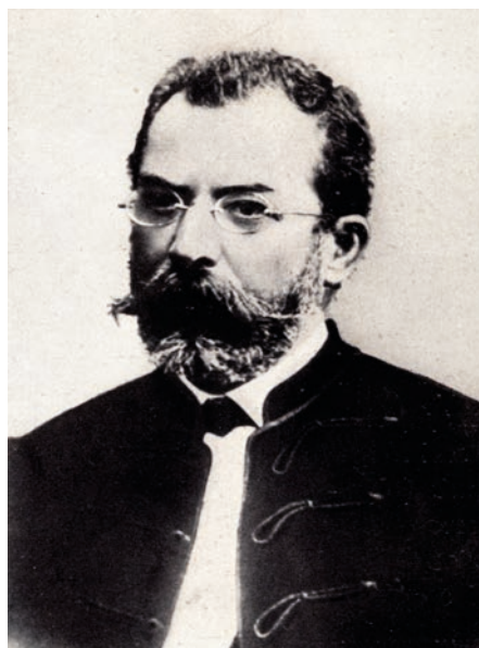
42. kép Maizner János (1828–1902), a szülészeti professzora (1872–1892)