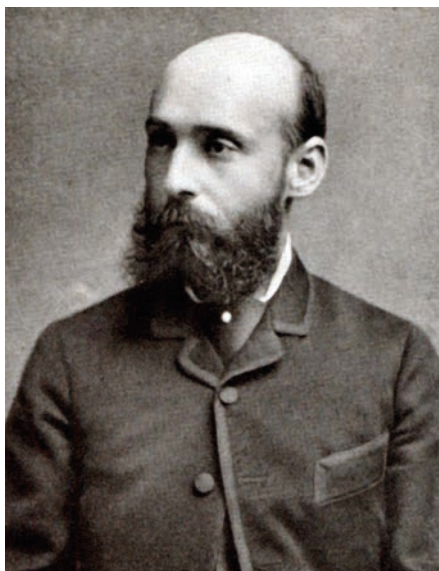
40. kép Lechner Károly (1850–1922), az elmekórtan professzora (1889–1922)