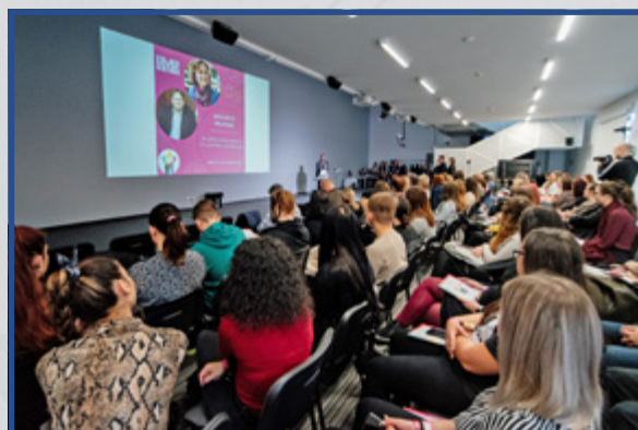
A XXIX. KMK megnyitója