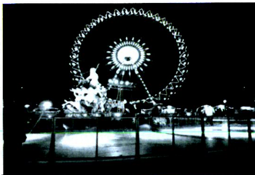
Óriáskerék a karácsonyi vásárban

gokról készített fotók. Az újságot különben a németszertárral szemben található hirdetőablán megtalálhatjátok.