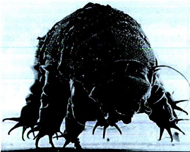
A cuki kis medveállat elektronmikroszkópos képe.

Testük zömök, négy szelvény alkotja, ezen testszelvények végén egy pár csonkaláb található, melynek végén 4-8 karmos ül. A testüket borító kutikula tartalmaz kitint, összetett cukrot