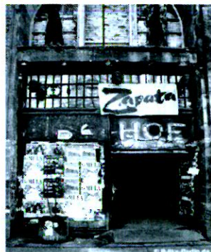
A Tacheles egyik bejárata