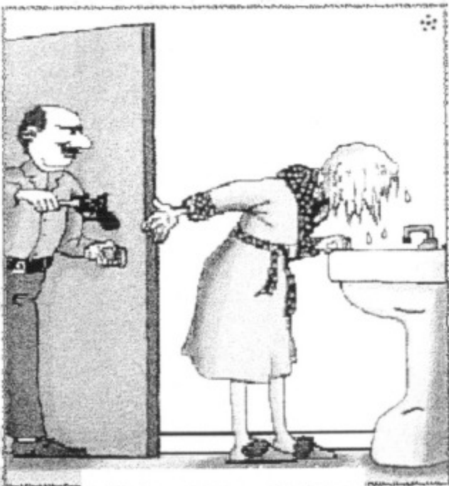
Drágám, itt van a hajszárítód...