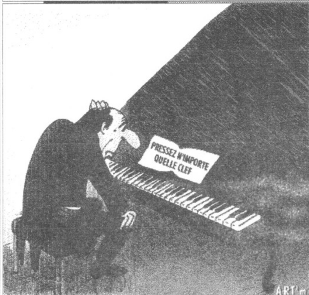
Az új évezred zongorája