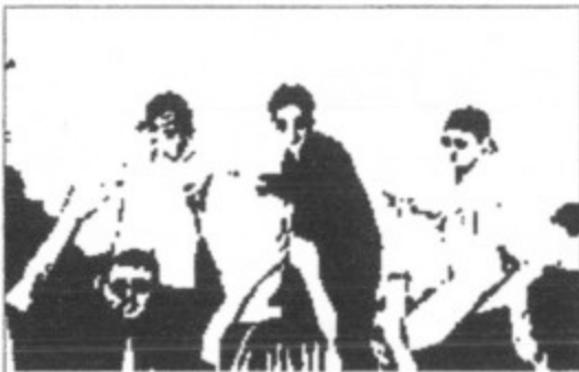
The Machos - a jövőbe tekintenek.

Lütkei G. cikkét /Style magazin/ egy kicsit aktualizálta: Frady