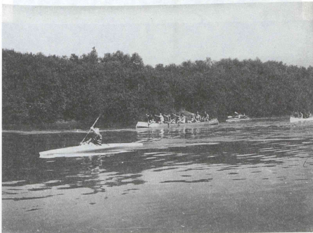
Evezés a Tiszán, 1974.