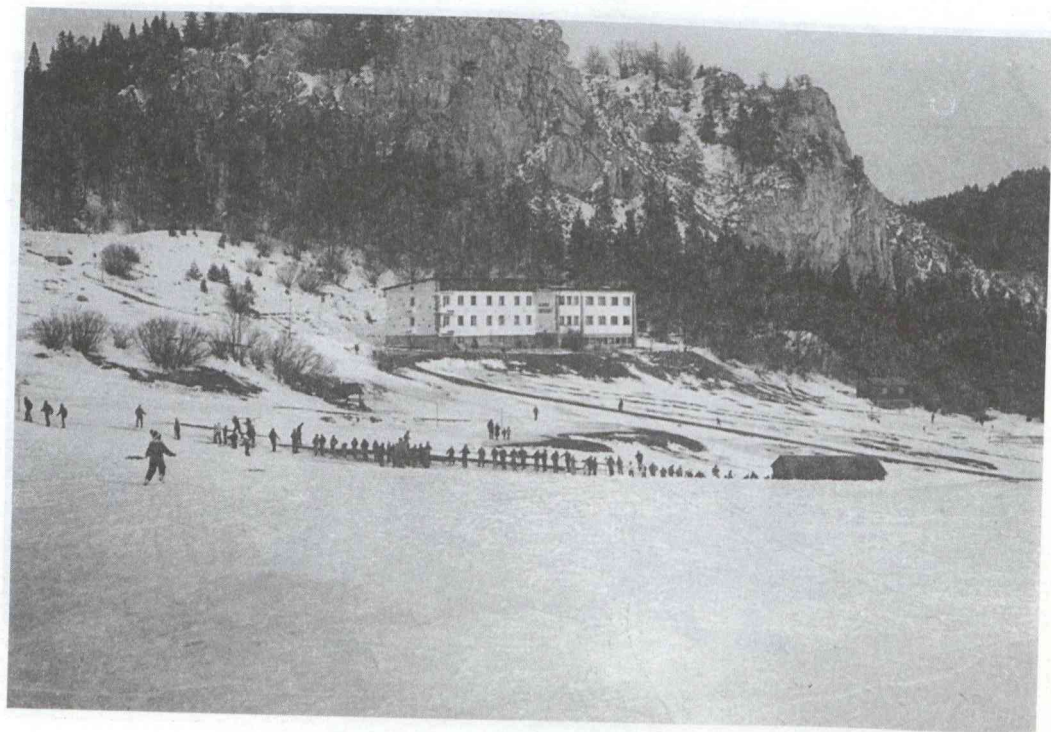
Malinó Brodó (Rózsa-hegy), 1980.