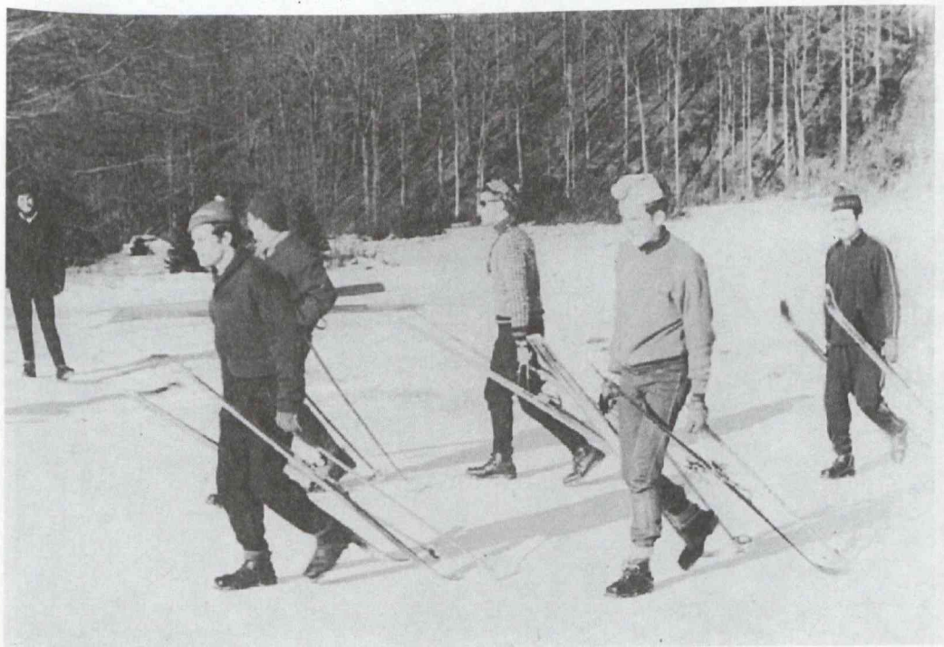
„Ősi felvonó”, 1969.