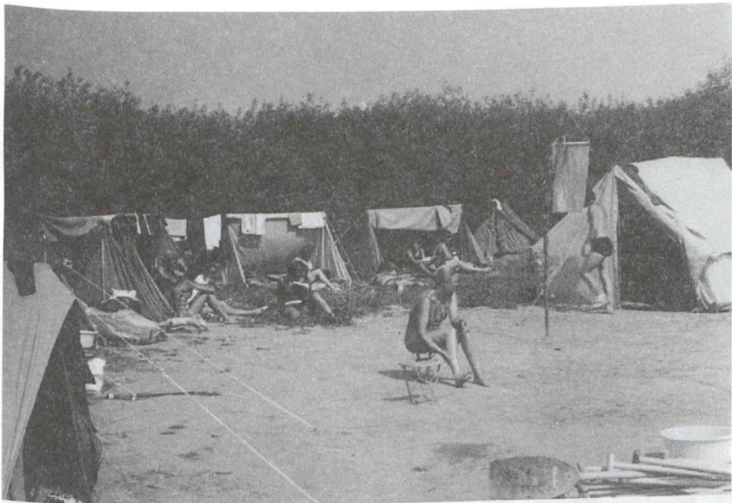
Sátortábor Algyőn, 1972.