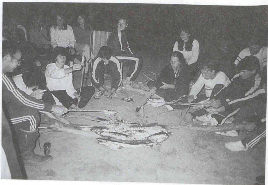
Melindó B. Esti halsütés, 1988.