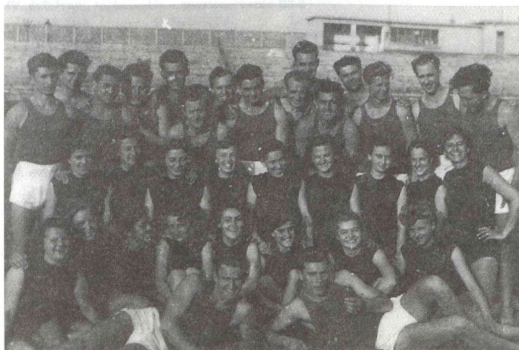
1955-ben végzett hallgatók.