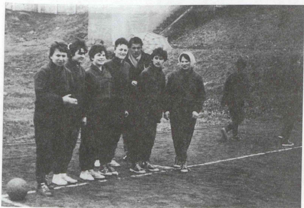
1964 évi kézilabda csapat - Bp. Kézisport - 1964

1951 évi női kézilabda csapat - Bp. Kézisport - 3:0