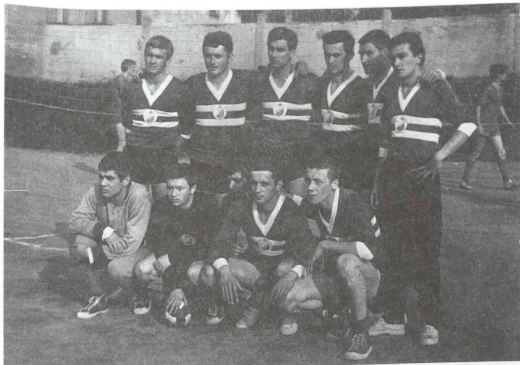
Férfi kézilabdacsapatunk 1968-ban.