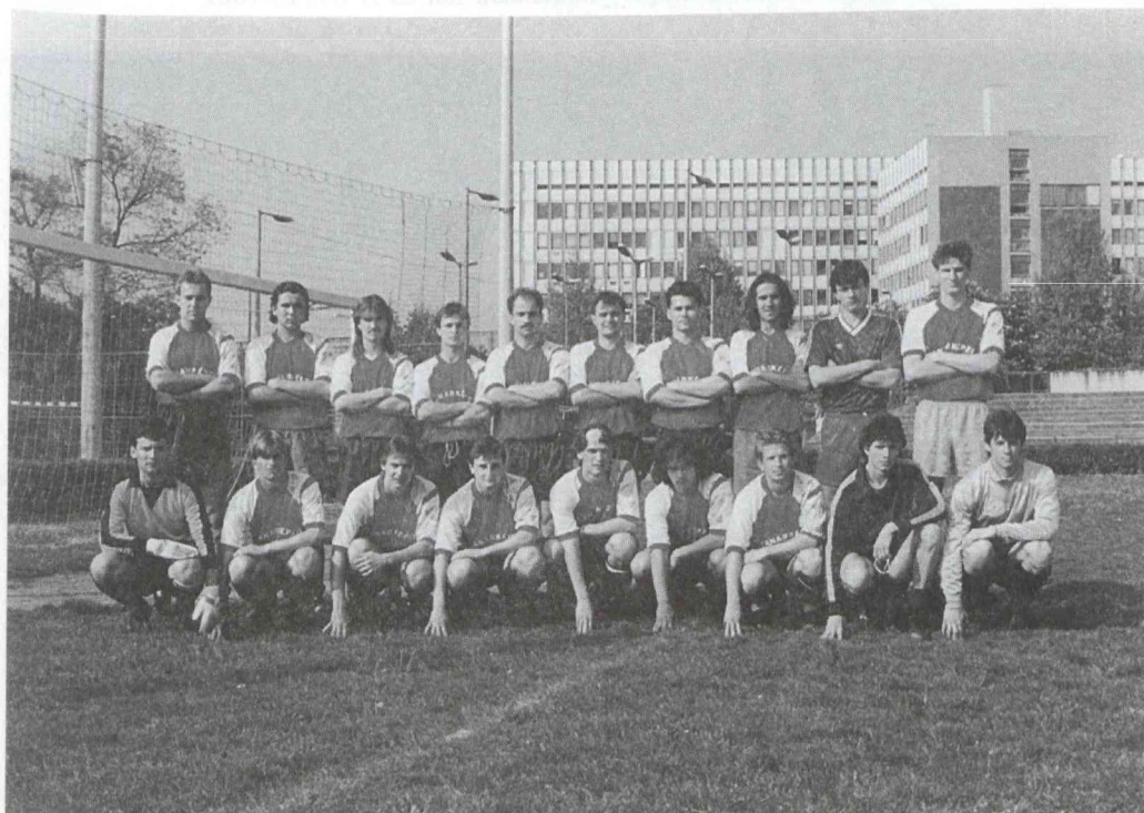
Labdarúgócsapatunk 1992-ben. A csapat tagjai a pályán állnak. A háttérben látható a modern épület.

Labdarúgócsapatunk 1977-ben. A csapat tagjai a pályán állnak. A háttérben látható a természet.