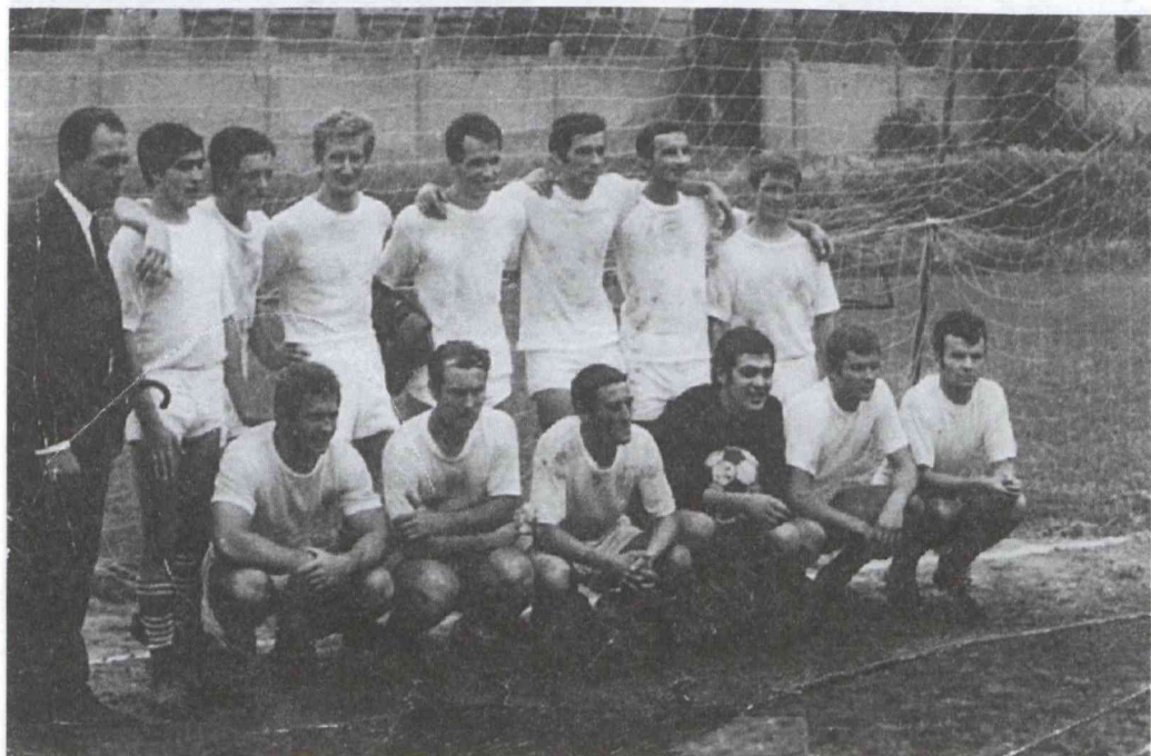
1968. Városi Bajnokságot nyert csapat.