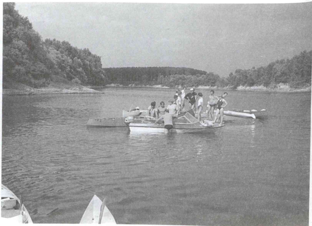
Szieszta a kis szigeten.