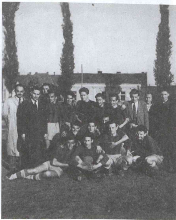
1951. április 24. Főisk. – Bp. Közg. Egy. 3 : 0