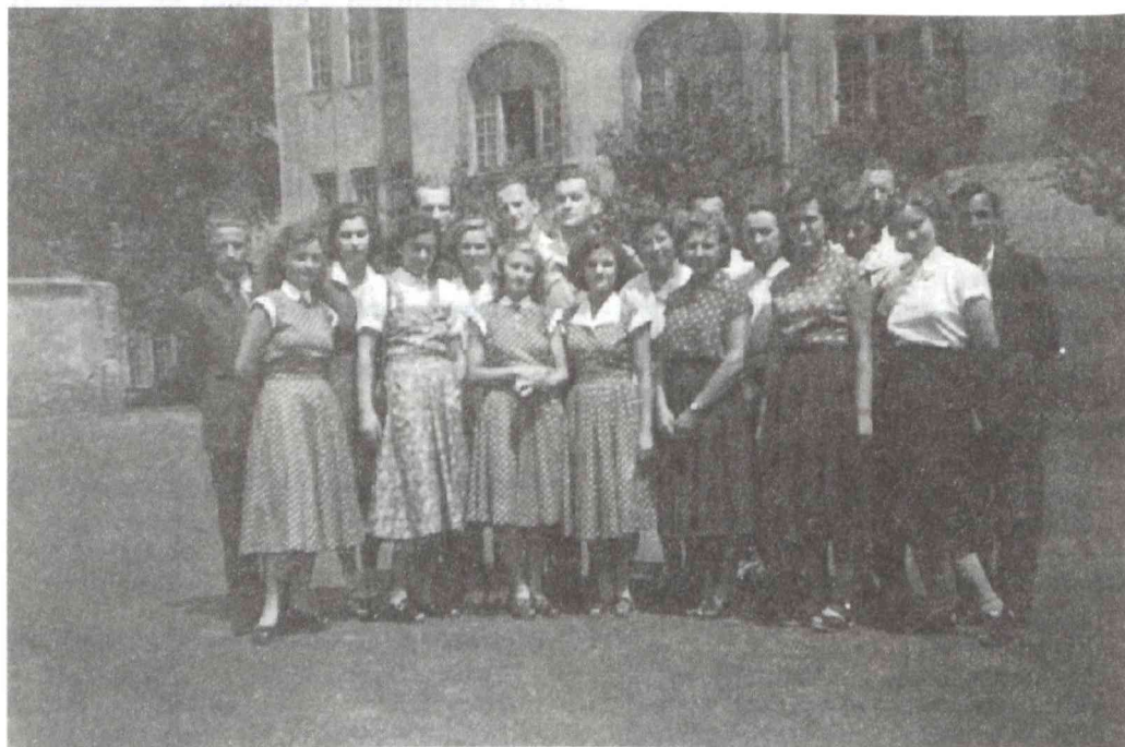
1952-ben végzett hallgatók Kardos tanár úrral.