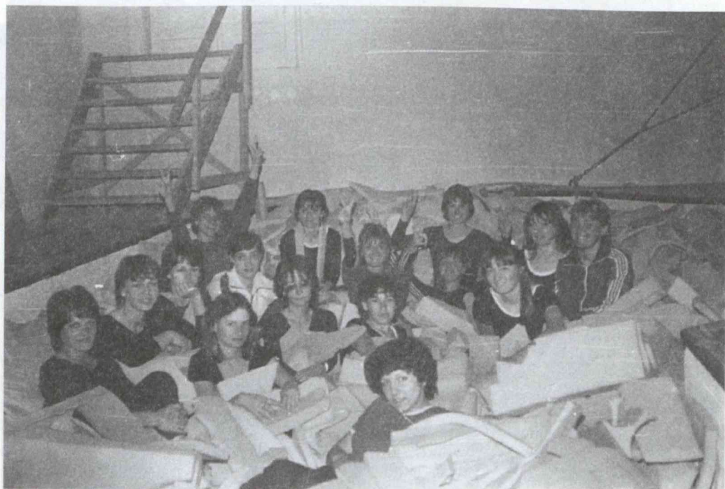
Torna óra vége, pihenés a szivacsban Kecskeméti tanárnővel.