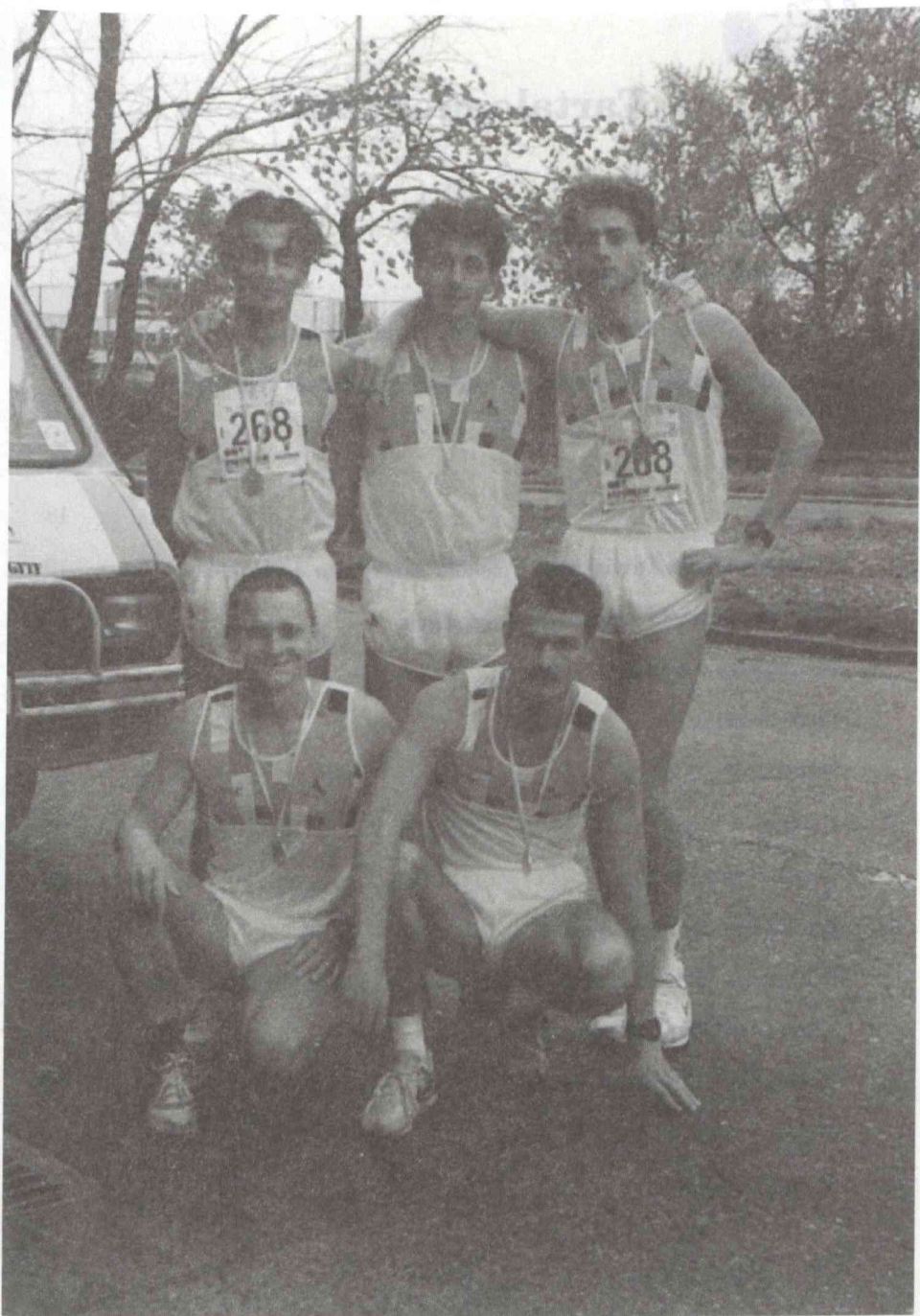
Bécs-Budapest maraton, 1992. Győztes csapatunk.