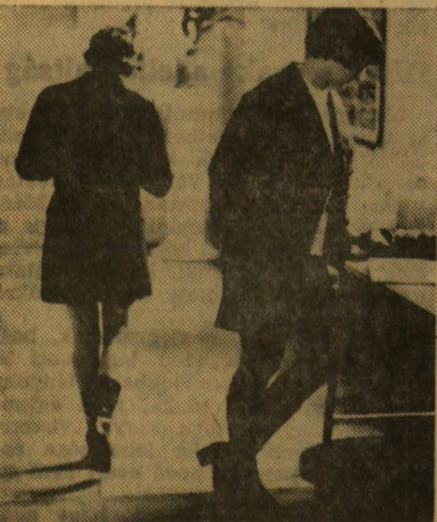
Pillanatkép a TTK folyosóján. Izgatott járkálással, jegyzetbepillantással, vagy éppen magábaroskadást semmibenézéssel várja a hallgató, hogy ő kerüljön sorra. Időnként meg-megrohanja az ajtón kilépő, boldog vagy boldogtalan, de mindenképpen szerencsés társát — ő már túl van rajta —: „Mi volt?!”