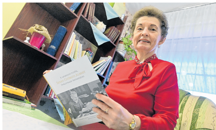
Tasiné Csúcs Ildikó közel egy évtizede kutatja a Nobel-díjas kutatóorvos életét és munkásságát.