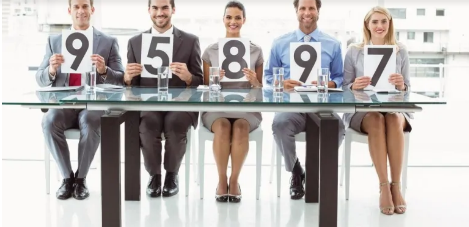
📷 Az állásinterjúkon egyre több pontot érnek a kompetenciák és készségek