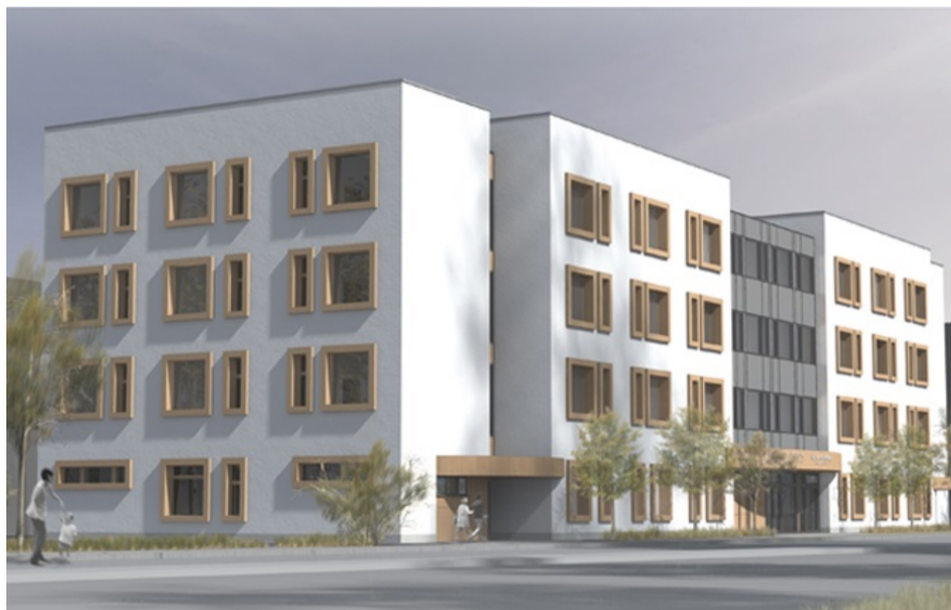
Látványterv az épületről.

Korábban arról írtunk , hogy a Szegedi Tudományegyetem célja egy olyan, a 21. század kihívásainak megfelelő infektológiai központ kialakítása, amely minden elemében megvalósítja az infekció kontrollal és járványügyi izolációval kapcsolatos irányelveit, és egyúttal képes havária helyzetek esetén – legyen az egészségügyi (járvány) vagy nemzetbiztonsági (terrorizmus, migráció, baleset) – kapacitásait rövid időn belül rugalmasan bővíteni. Ez különösen érdekes most, amikor valódi egészségügyi havária helyzet van.