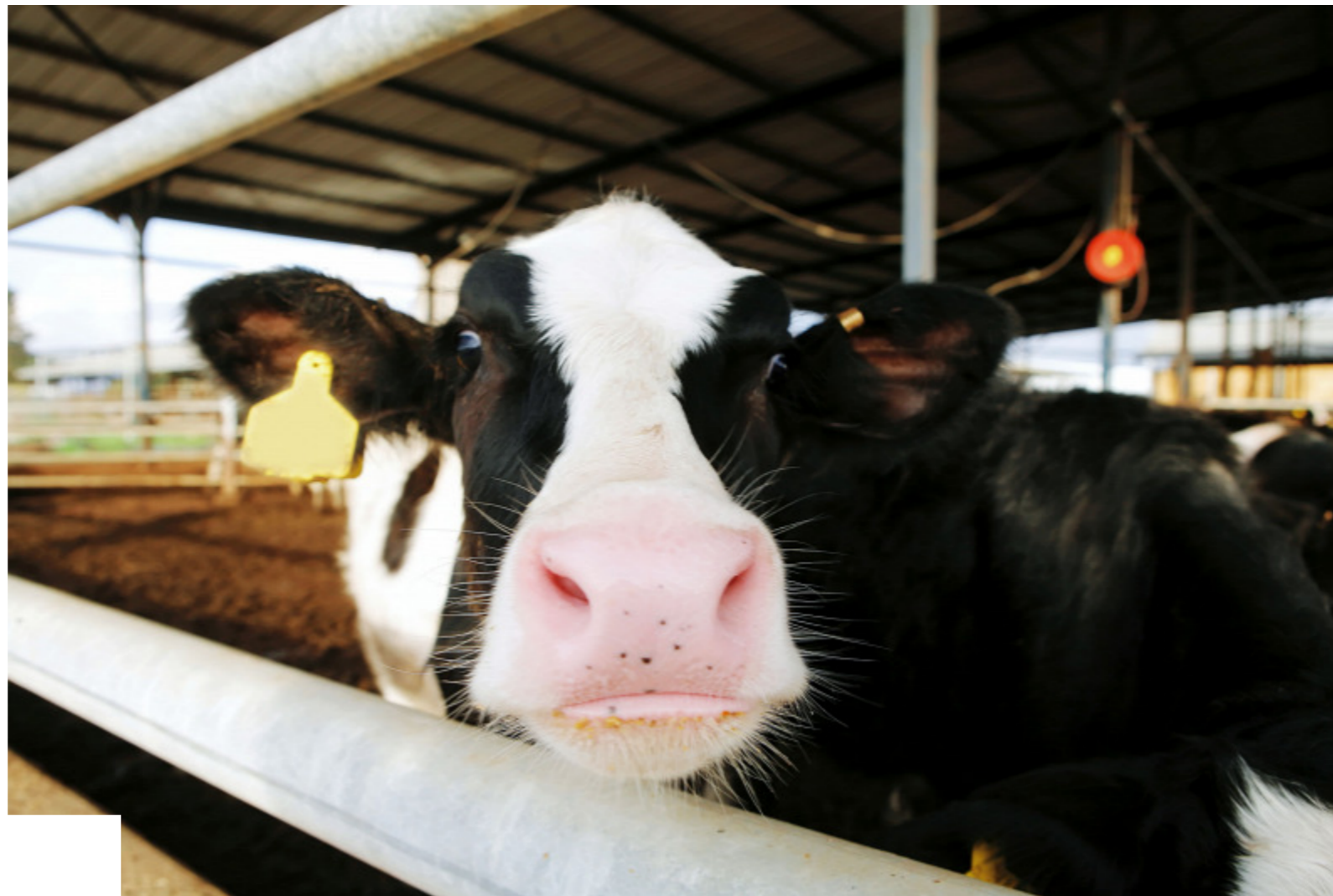
Most azonnal inszeminálni akarok, mehetek?!

A résztvevők szakmailag felkészült oktatók segítségével 120 elméleti és 180 gyakorlati órában sajátíthatják el a legfrissebb szakismereteket. A gyakorlati képzés helyszínét az SZTE biztosítja Hódmezővásárhelyen.