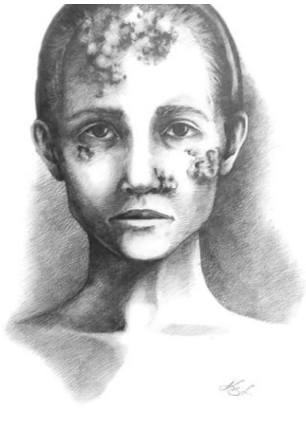
A fiatalabb nő koponyája és rekonstrukciós rajza, arcán valószínűsíthető tünetekkel.

Szavaiból pedig érződik, hogy esetünkben is voltak, akik más véleményt képviseltek. Egyes tudósok szerint ugyanis a betegség már Kolumbusz útja előtt is jelen volt Európában, ez az úgynevezett prekolumbián elmélet. Legfőbb érvük pedig, hogy a korabeli orvosok nem mindig voltak tisztában a betegségek természetével, leírásaikban a szifilisz is keverhették vagy féltucatnyi egyéb kórral. A vita ritkán látott hevességgel folyt szakmai körökben több mint egy évszázada.