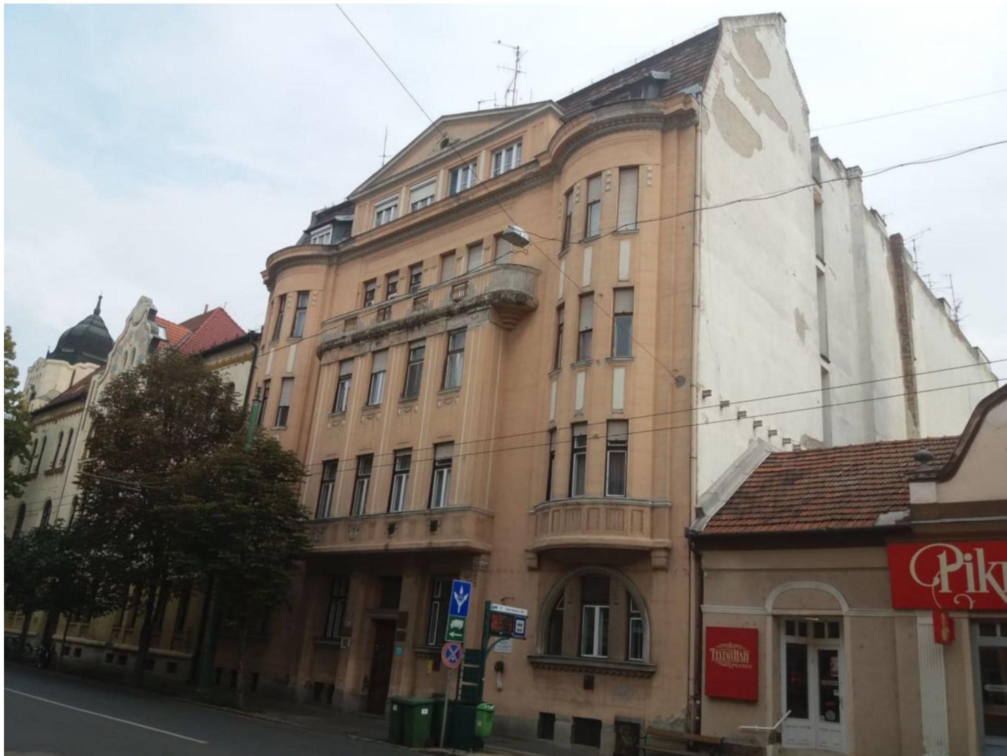
Szentháromság utca 4. – itt lakott a szótárkészítő professzor