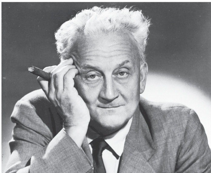
Szent-Györgyi Albert 1950-ben.

AZ ABLAKON MENEKÜLTEK Aztán egy színelőadás „zsidó erotikája” miatt tiltakoztak, nekiálltak az önkényes igazoltatásnak