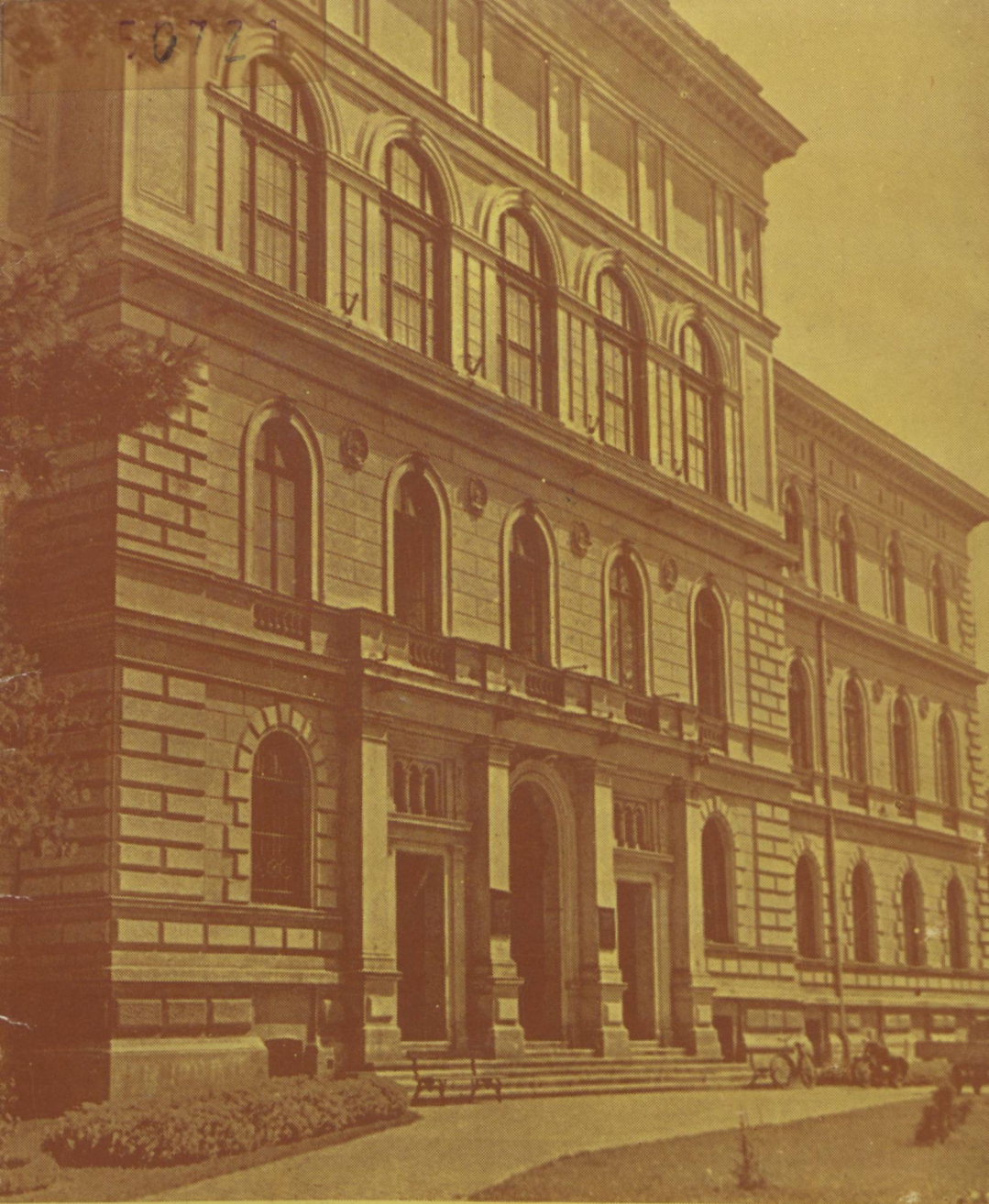
JÓZSEF ATTILA TUDOMÁNYEGYETEM KÖZPONTI KÖNYVTÁRA