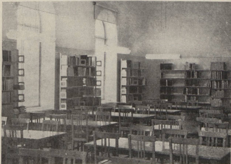
A könyvolvasóterem (Részlet)

Azokat a könyveket, amelyeket az olvasó nem talál meg az olvasótermi kézikönyvtár anyagában, — de a könyvtár állományában megvannak — a „Kérőlap” kitöltése után a felügyelő felkéri a raktárból.