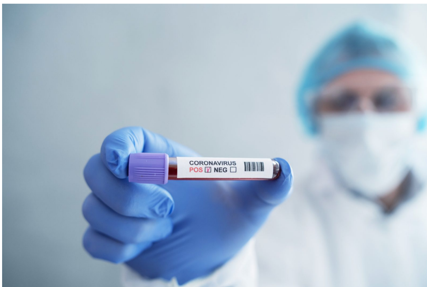
Coronavirus blood test in hospital laboratory

SZERZŐ: RÓTH BALÁZS · 2020. AUGUSZTUS 26. SZERDA