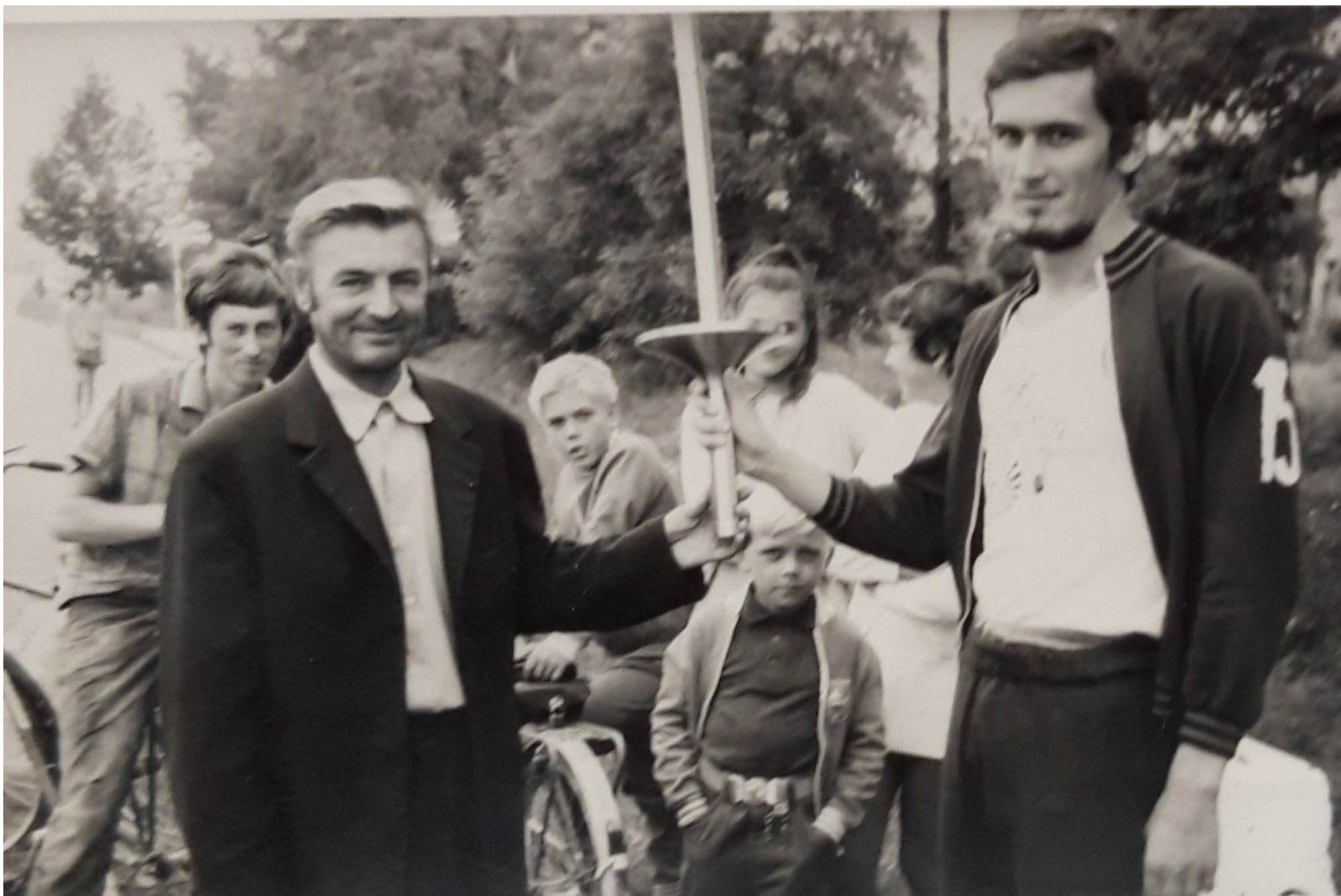
Sokan várták a lángot vivő sportolókat az útvonal mentén, hogy fotózkodjanak velük