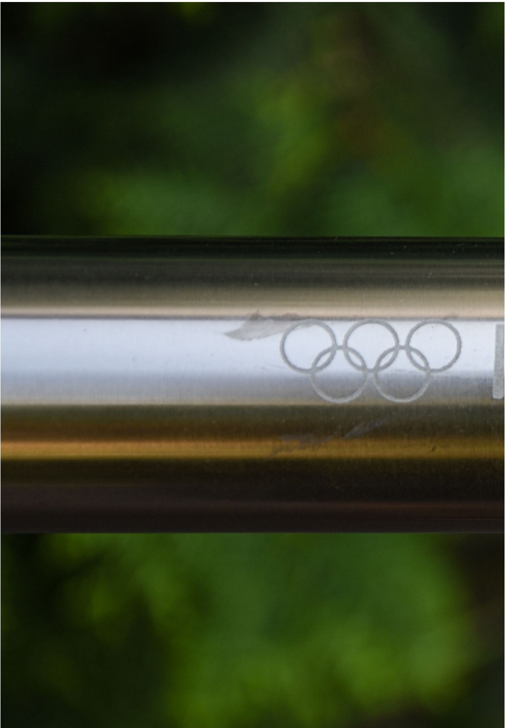
Zöllei doktor azóta is őrzi a fáklyát