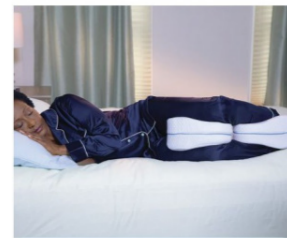
Dreamolino Leg Pillow lábtámasztó párna 1+1 csomag