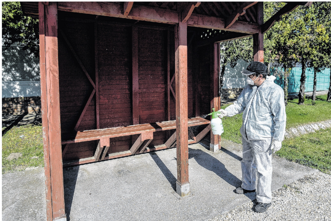
Van, ahol újra gyakran fertőtlenítik a közterületeket is. ILLUSZTRÁCIÓ: TÖRÖK JÁNOS