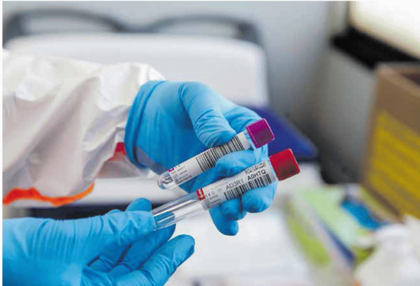
A megvizsgált tízezer minta közül csak három pozitívat találtak a kutatók

– Azt mondhatjuk, hogy Magyarországon mind az aktív fertőzöttek száma, mind az átfertőzöttség alacsony volt az újrainytáskor – hangsúlyozta Merkely Béla, hozzátéve: ezekből tudták, hogy nyáron kedvező járványügyi helyzet várható. A behurcolt esetek azonban bár-