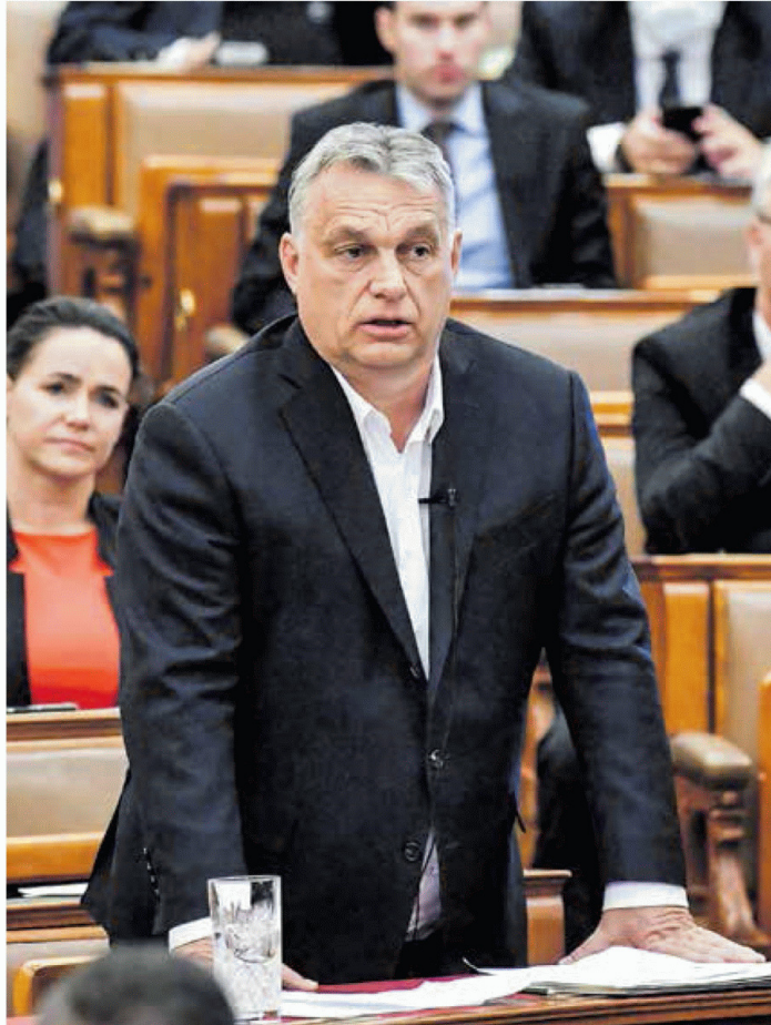
A szavazók elégedettek a kormányfő munkájával

A felmérés szerint az Orbán Viktorral elégedettek tábora még a kormánypártok szimpatizánsi körénél is nagyobb, a Nézőpont Intézet májusi