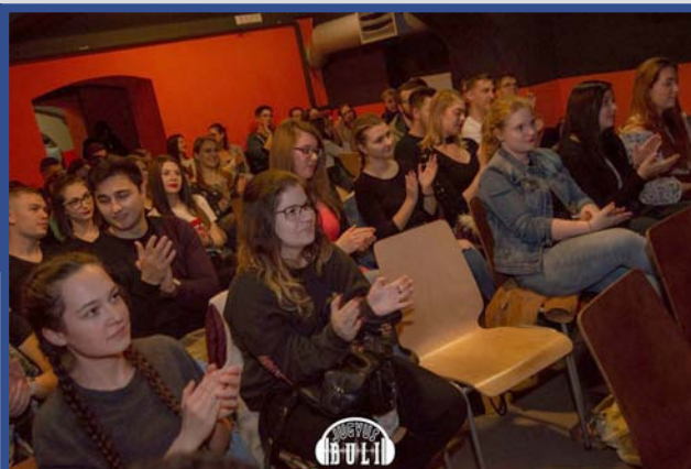
Jugyus Slam Est