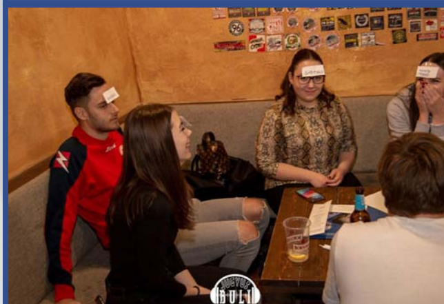
Jugyus Társasjáték Est