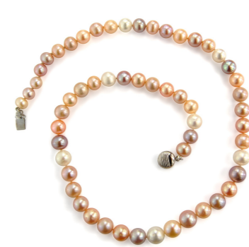
Multikolor édesvízi igazgyöngy nyaklánc 59 990 Ft