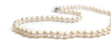
Édesvízi gyöngyör ezüst kapoccsal 49 000 Ft