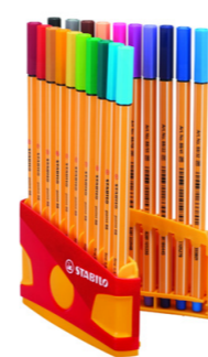
STABILO point 88 tűfilc készlet "ColorParade" 4 680 Ft