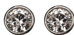
Ezüst keretes cirkónia pötty fülbevaló 6 990 Ft