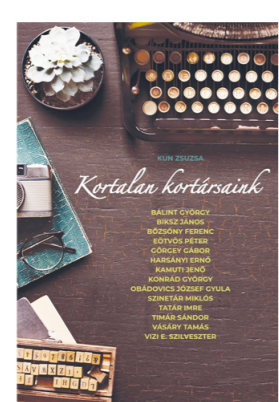
Kortalan kortársaink 3 995 Ft