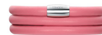
Háromsoros rózsaszín bőr karkötő 4 990 Ft