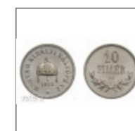
Ferenc József 10 fillér 1915 KB, Cu- Zn-Ni, UNC!

A 99. évében járó asszony nál, a korára való tekintettel, hétfőn délelőtt a lakhelyén végezték el a vizsgálatokat.