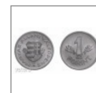
1 forint 1946, AUNC- UNC!