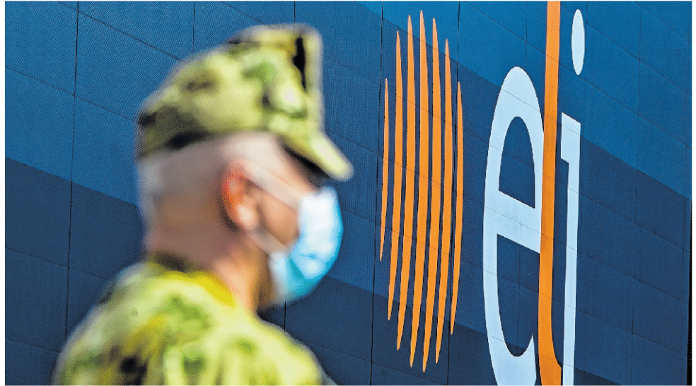
A Magyar Honvédség közreműködésével kiszolgálókonténereket is telepítenek az ELI-hez.

– Az ötlet onnan adódott, hogy az ELI-nek van egy olyan speciális csarnoka, amelyet olyan kísérletek számára alakítottunk ki, amelyek során fontos, hogy a térből ne szabadulhasson ki semmi. Ez a kívánalom a koronavírus esetén is, ezért ajánlottuk fel a két termet, amelyekben összesen 118 ágyat tud elhelyezni az egyetem, ezek mindegyike alkalmas a lélegeztetésre. Így abszolút 21. századi körülményeket tudunk biztosítani az egészségügyi ellátáshoz, ráadásul megoldott, hogy külön ajtón közlekedjen a munkába