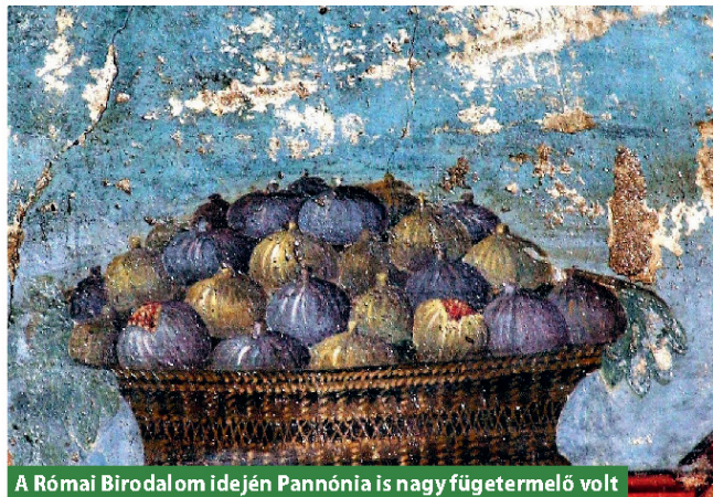
A Római Birodalom idején Pannónia is nagy fügetermelő volt

hető volt a számára, így megjárta Keletet és Nyugatot is. Ezekből a lehetőségek-ből született a reformáció és az a vallási béke, ami Erdélyben megmutatkozott. A nagyállattartó gazdálkodást folytató emberek szintén elképesztő nemzetközi tapasztalatokra tehetek szert. Felhízlalták a több tízezer marhát, és kibérelték az útvonalat Bécsig, Nürnbergig, Augs-