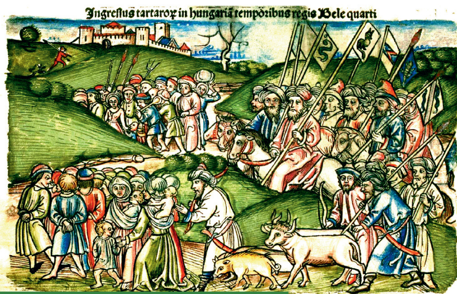
Ha nem fagy be a Duna, talán a tatárjárás is máshogy alakult volna

– Most ugyan előkerültek olyan régészeti adatok, amelyek szerint esetleg korábban történhetett, de induljunk ki abból, hogy 895-ben volt. Az utolsó nagy hullámban annak a vándorlási időszaknak, ami a 370-es években kezdődött. Akkor a hunok átkeltek a Volgán, és a nagy germán tömegeket rátolták a Nyugatrómai Birodalomra, aminek következtében az összeroskadt. Ennek oka pedig egy hűvös és száraz időszak volt, aminek következtében Kínától Nyugat-Európaig a nagy sztyepei folyosón kevesebb fű sarjadt. Ez az egypillérű, állatállományra épülő gazdaság számára végzetes. Ha pedig elveszíti az állatállományát egy nomád törzs, két választása van. Az egyik az, hogy rátámad a szomszédra, és elveszi az övét a legelőterületével együtt. Ez elindított egy dominanciát, ami a magyarokat elsodorta egészen a Kárpát-medencéig. A másik lehetősége egy népnak, hogy elmegy vazallusnak az erősebbhez: a kabar törzsek így csatla-