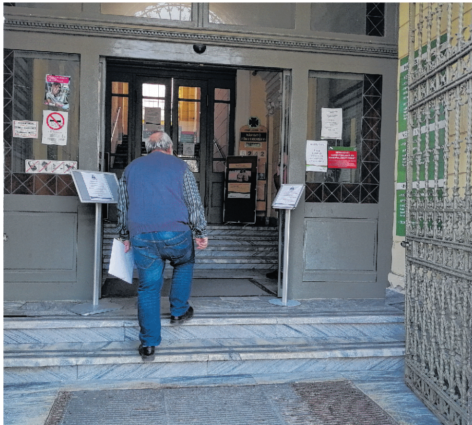
Nem kell postára menniük az idősöknek az utalványok beváltásáért.