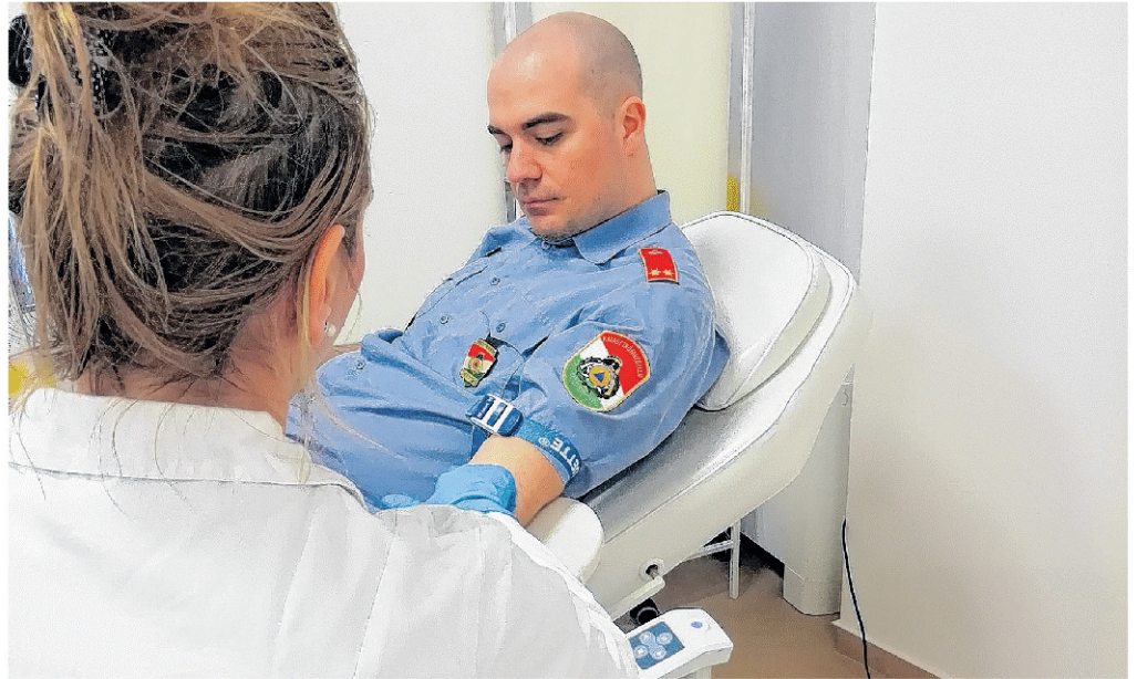
Vért adtak a megyei tűzoltók, segítve a biztonságos betegellátást.

NEGATÍV LETT MINDEN TESZT A Szegedi Tudományegyetem lapunkhoz eljuttatott közleménye szerint a Rovó László rektorral kapcsolatba került több mint 120 kontakt második mintavételeinek eredménye is negatív lett. A járványügyi vizsgálat azt is megállapította, hogy a Szegeden fertőzöttnek bizonyult személyekkel a rektor nem találkozott, tőle teljesen független esetekről