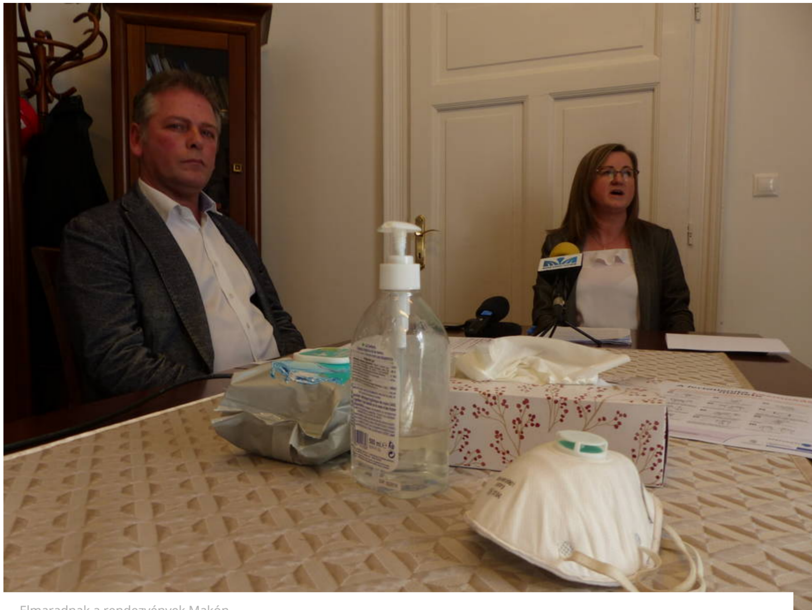
Elmaradnak a rendezvények Makón.