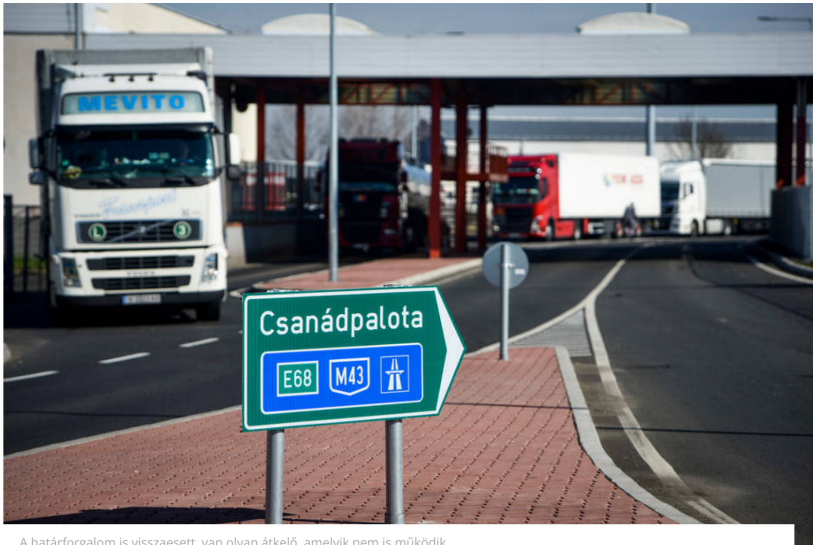
A határforgalom is visszaesett, van olyan átkelő, amelyik nem is működik.