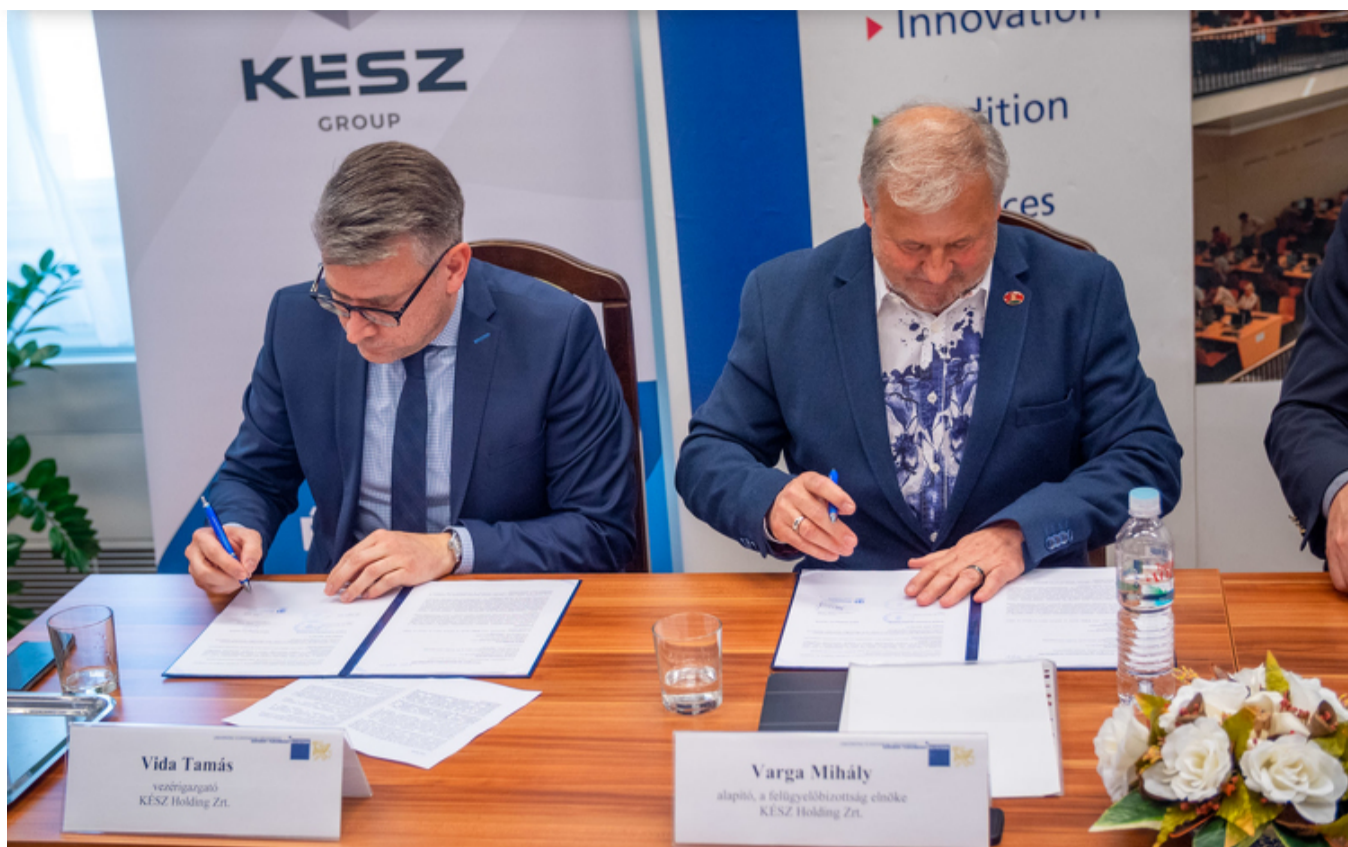
Kattintva galéria nyílik az eseményről

Az esemény sajtóanyaga szerint a partnerek kutatás-fejlesztési projekteket szeretnének indítani, különös tekintettel a higiénia, a műszaki technológia, a szabványosítás és az akkreditáció szakterületére. A megállapodás szerint a Szegedi Tudományegyetem a képzéseinek megtervezésekor figyelembe veszi és beépíti a tantervbe a KÉSZ Csoport által már megvalósított és folyamatban lévő fejlesztéseket.