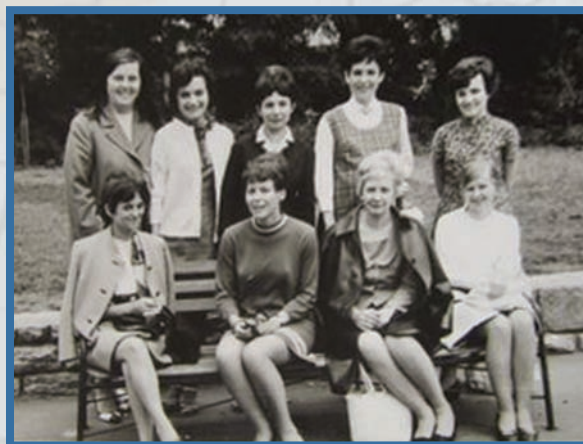
A csoport közös fotója az utolsó konzultáció végén készült 1969-ben.

Tanári oklevelét 1969-ben szerezte a Szegedi Tanárképző Főiskola magyar-orsz szakán. A Szobi Általános Iskola és Gimnáziumban kezdte meg pedagóguspályáját 1964-ben képesítés nélküli nevelőként. 1965–1970 között Márianosztrán, 1971–1978 között Alsónémedin az Általános Iskolában tanított, valamint úttörővezetői feladatokat látott el. 1980-tól 1984-ig a dabasi Járási Hivatal általános tanulmányi felügyelője volt. 1991–1995 között az Ócsai Bolyai János Gimnázium magyar- és némettanára. 1995–2000 között a Dánszentmiklósi Ady Endre Általános Iskola igazgatója. 2000–2006 között nyugdíjas tanár Dánszentmiklóson és Pustavacson. Pedagógus munkája folytonosságát egyéb közösségi megbízatásai szakították meg (Dabas: