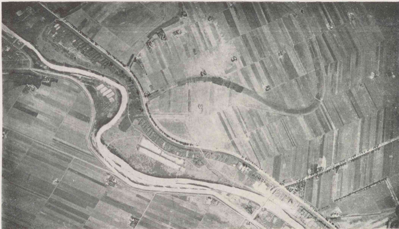
A Fehér-Körös szakasza Mezőberénytől északkeletre. Légi felvétel 2000 méter magasságból.