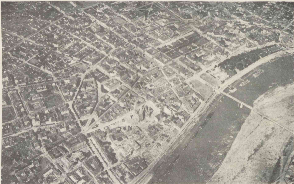
Szeged belvárosa, légi felvétel 2000 méter magasságból.

Az egyetemi Földrajzi Intézet kezdeményezésére készítette a Magy. kir. Állami Térképészet fotogrametriai osztálya.