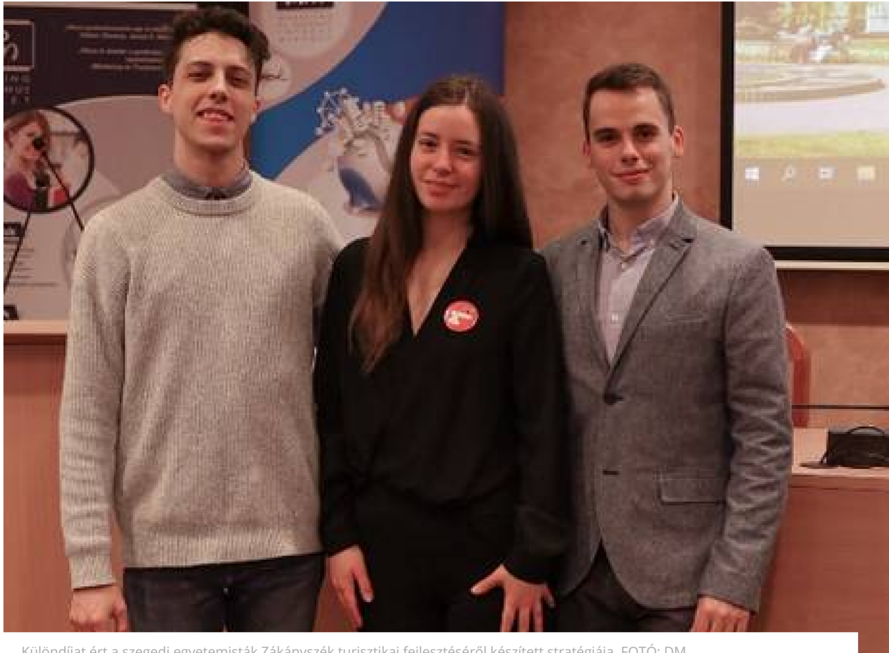
Különdíjat ért a szegedi egyetemisták Zákányszék turisztikai fejlesztéséről készített stratégiája.

Megismerve a napjainkra jellemző turisztikai trendeket, a turisták jellemző döntési, magatartási szokásait, a környezeti feltételeket, mutassák be, hogy milyen irányba lenne szükséges fejleszteni a város turizmusát, mivel lenne növelhető vonzereje. A tanulmány második részében foglalmazzanak és tervezzenek meg egy marketingkommunikációs, értékesítést támogató programot.