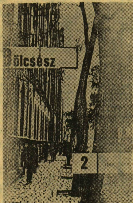
A Bölcsész címlapja

— Ellenkezőleg. A „Bölcsész” írásával eddig közel húszan foglalkoztak. És — aki kipróbálta tehetségét a mi