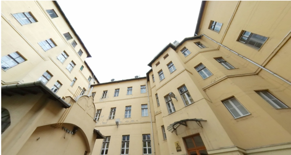
A szegedi kollégium belső udvara.

ezer forint. Balla erről azt írta, „szervezetenként kb. másfél millió forint volt a kiállítás ára”.