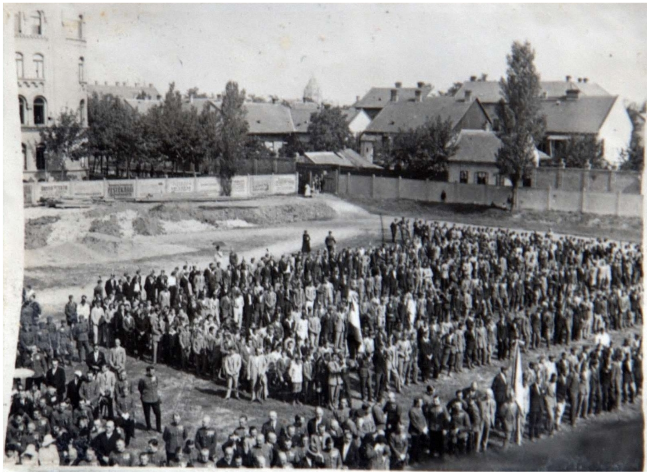
Az 5. honvédek ünnepélye az Ady téren.