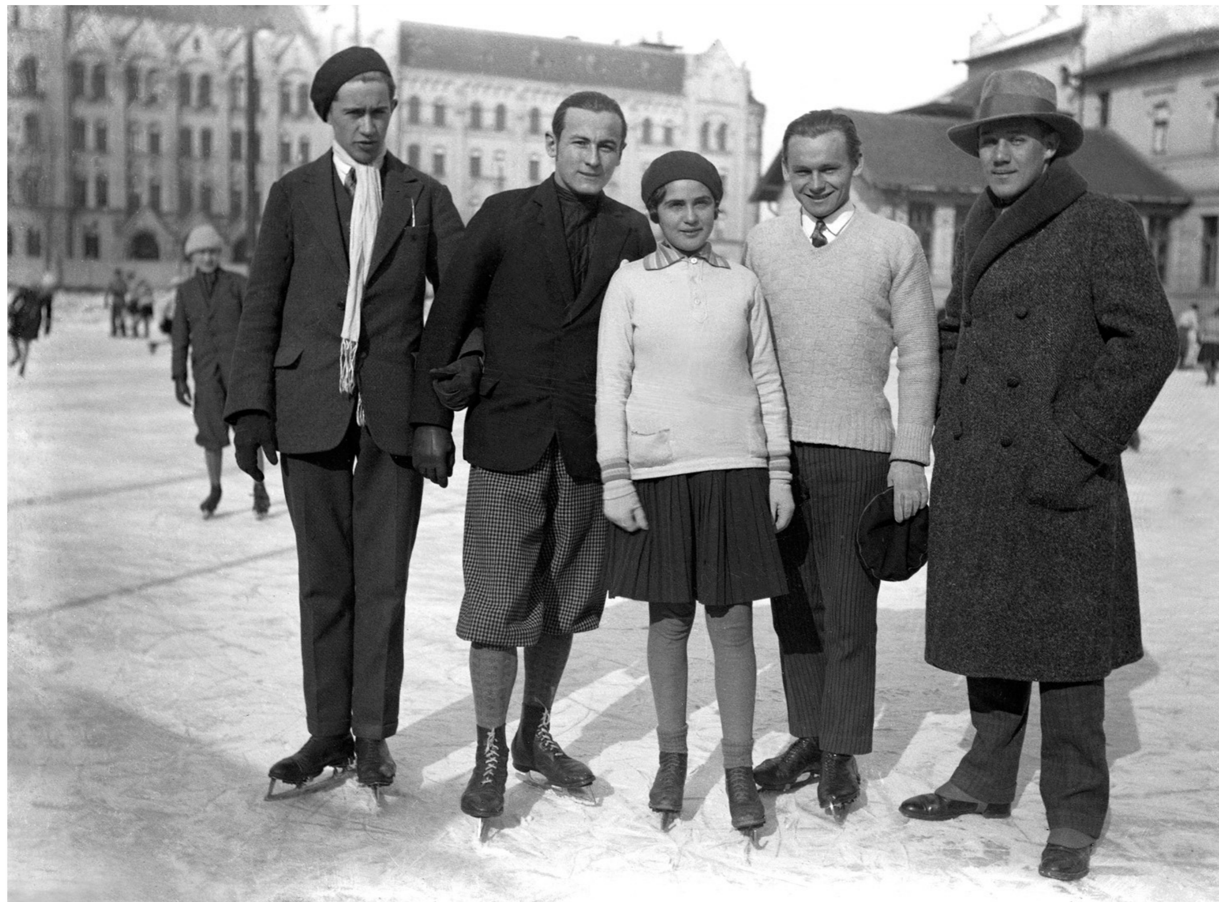
Egy sokáig magántulajdonban lévő 6x9cm-es üvegnegatívról életre hívott felvétel, amely 1920-ban készült a jégpályán, háttérben az ekkor még teljes pompájában látható vasúti leszámolóhivatallal, ami csak később került az egyetemhez.