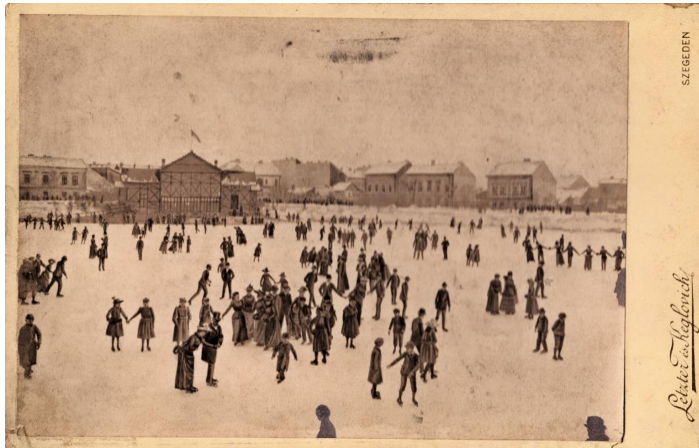
Ennek a fényképnek a helyét igencsak nehéz belőni, hiszen a mai bölcsészkar ekkor még nem állt, a házak jó része pedig nem áll már, de ha mégis megpróbáljuk, talán a háttérben jobboldalt a Zászló utca házait véljük felfedezni.

„Az ismét hidegre fordult időjárás lehetővé tette a Postás SE jégkorong szakosztályának a jégpálya elkészítését, amelyet csütörtök délután adnak át rendeltetésének. Az egyesület vezetősége a tömegsportolás megteremtése érdekében, amennyiben az időjárás lehetővé teszi, vasárnap reggel 9 órai kezdettel ifjúsági korcsolyázó és jégkorong toborzót tart a pályán. A toborzón részt vett ifjúságot azután edzés útján kiképzés alá veszik, hogy ezzel is lehetővé tegyék Szegeden a jégportolás fejlődését” – írta a Délmagyarország 1948 decemberében.