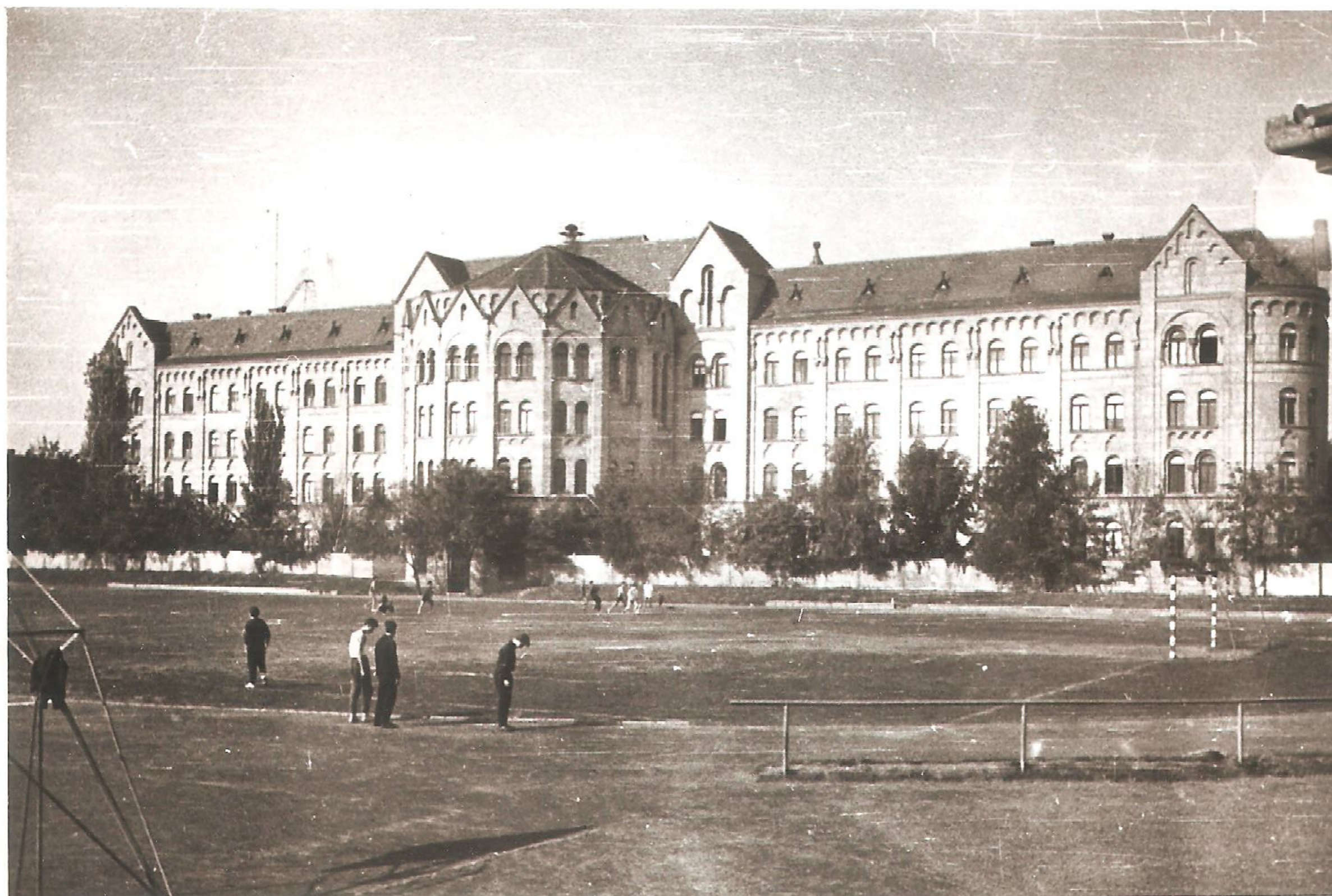
A sportpálya az 1960-as években.