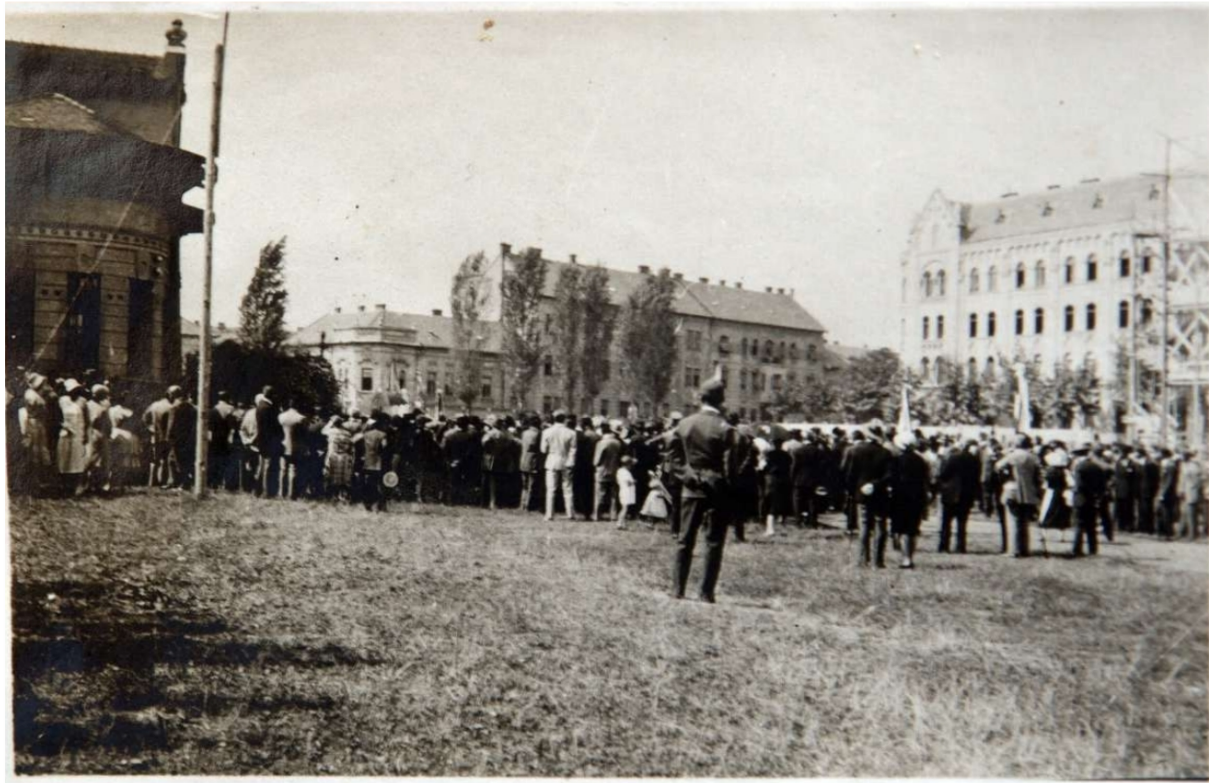
Az 5. honvédek ünnepélye az Ady téren.