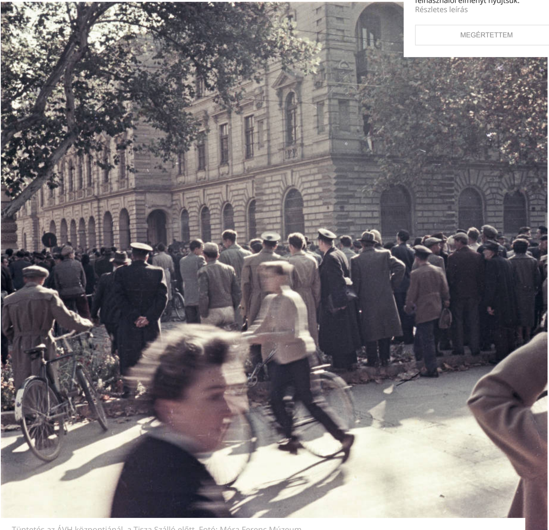
Tüntetés az ÁVH központjánál, a Tisza Szálló előtt.