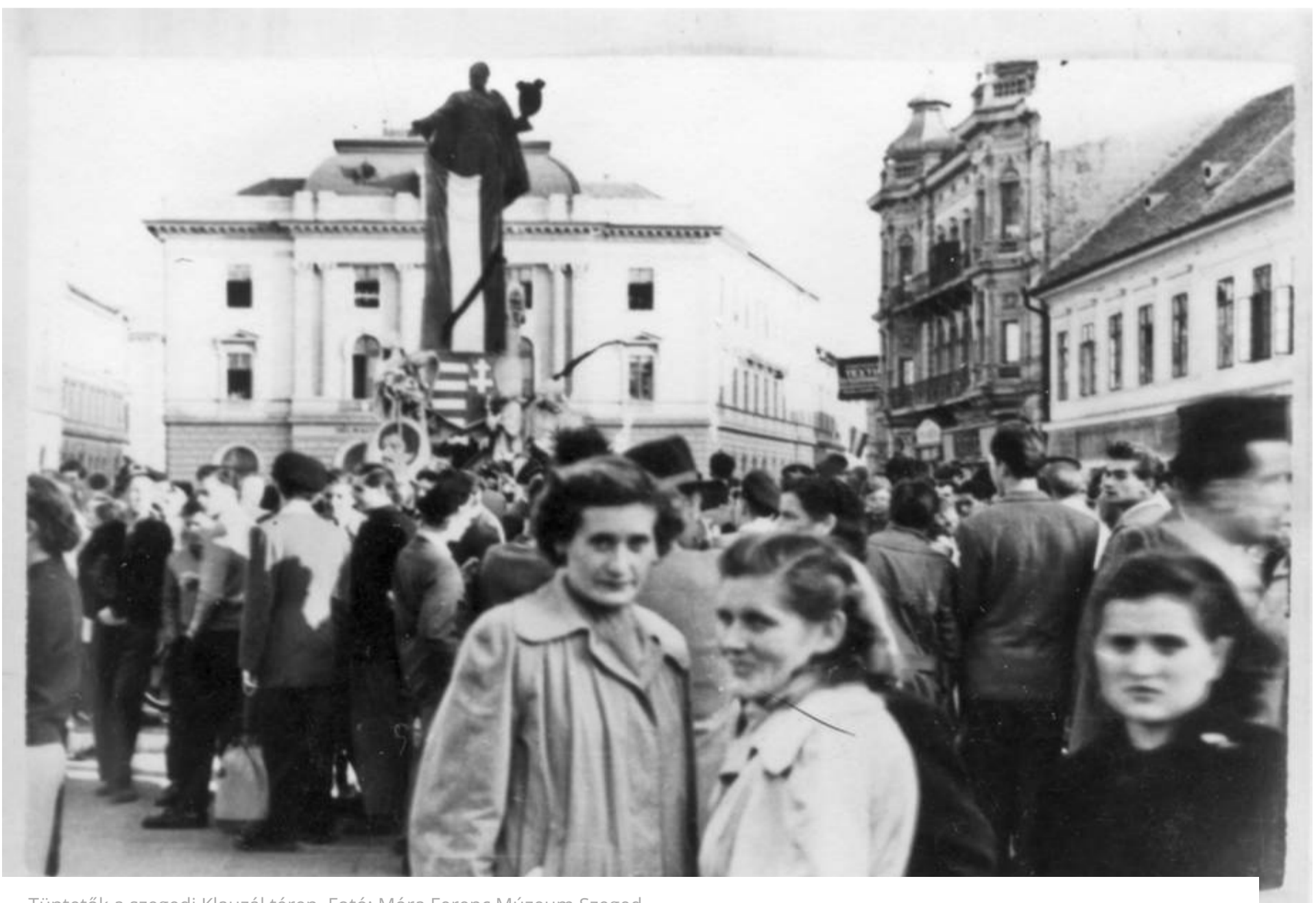
Tüntető a szegedi Klauzál téren.