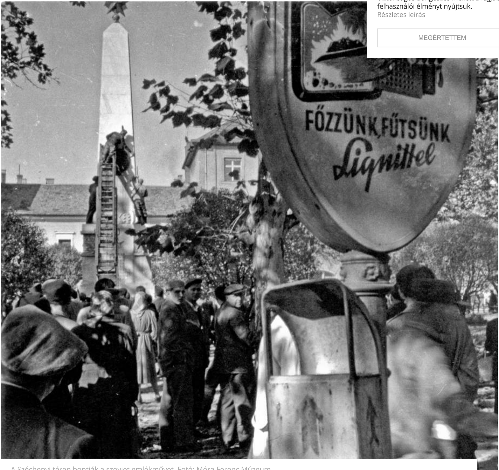
A Széchenyi téren bontják a szovjet emlékművet.